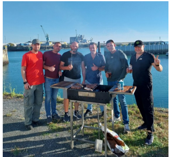
Equipage du BOCS BREMEN