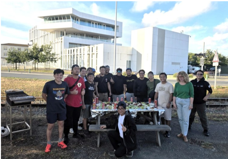
Equipage du LOWLAND LUKE