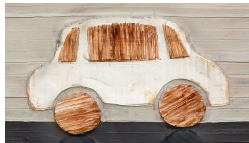
Promotion d'Activités de Soutien et de Services d'Accompagnement de Jeunes et d'Enfants