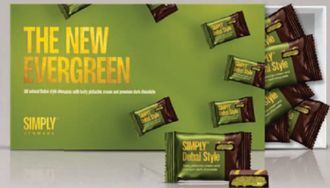
The new evergreen - 15 stk. / 150 g. Gaveæske med 15 stk. chokoladebites: Dubai Style mørk chokolade