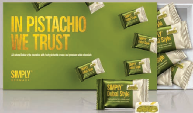
In pistachio we trust - 15 stk. / 150 g. Gaveæske med 15 stk. chokoladebites: Dubai Style hvid chokolade