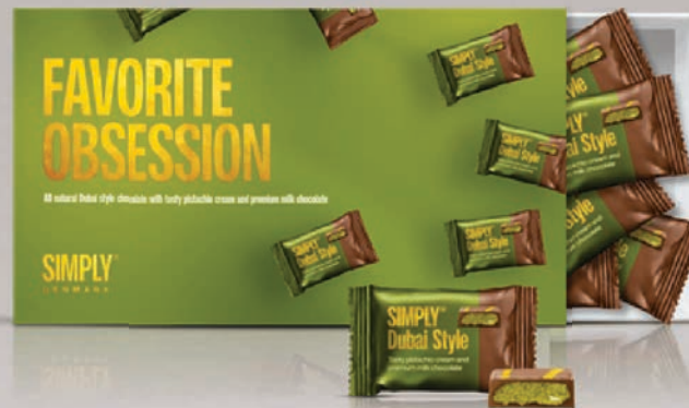
In pistachio we trust - 15 stk. / 150 g. Gaveæske med 15 stk. chokoladebites: Dubai Style mælkekchokolade