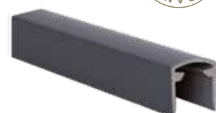
PROFIL DE FINITION