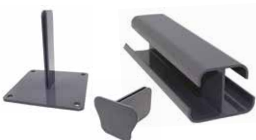
POTEAU MULTIFONCTION - CAPOT - PLATINE