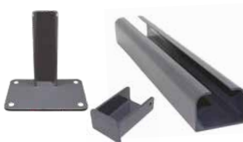
POTEAU DÉPART/FIN - CAPOT - PLATINE