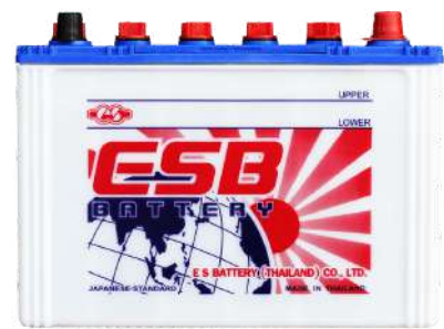
ESB BATTERY S555L

REF : 95D31 AMP : 85 CCA : 590 SIZE(mm.) : 173x305x225