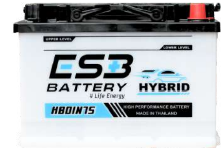
ESB BATTERY HB0IN75L

REF : 95D31 AMP : 90 CCA : 650 SIZE(mm.) : 173x305x225