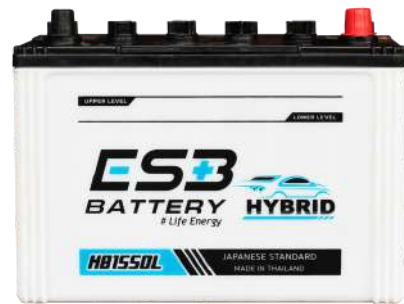
ESB BATTERY HB1550L

REF : 80D31 AMP : 80 CCA : 575 SIZE(mm.) : 173x305x225