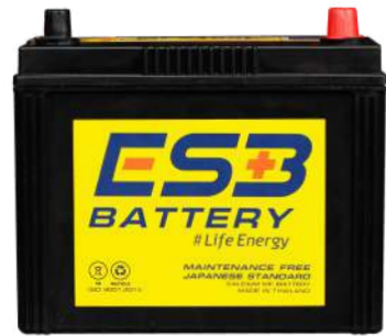
ESB BATTERY MFZ105L

REF : 80D26 AMP : 80 CCA : 580 SIZE(mm.) : 171x258x225