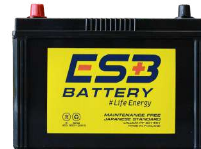
ESB BATTERY MFZ135R

REF : 85D31 AMP : 85 CCA : 680 SIZE(mm.) : 173x305x225