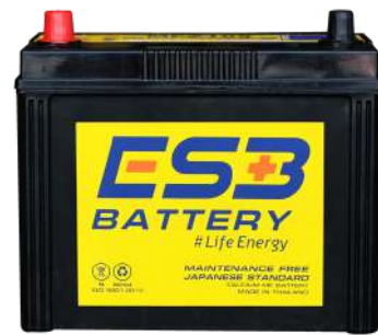
ESB BATTERY MFZ105R

REF : 80D26 AMP : 80 CCA : 580 SIZE(mm.) : 171x258x225