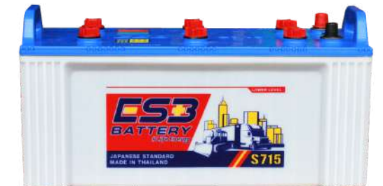
ESB BATTERY S715

REF : N120 AMP : 120 CCA : 680 SIZE(mm.) : 182x504x257