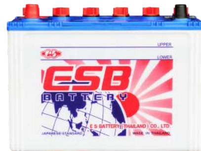
ESB BATTERY S555R

REF : 95D31 AMP : 85 CCA : 590 SIZE(mm.) : 173x305x225