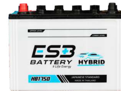
ESB BATTERY HB1750R

REF : 95D31 AMP : 90 CCA : 650 SIZE(mm.) : 173x305x225