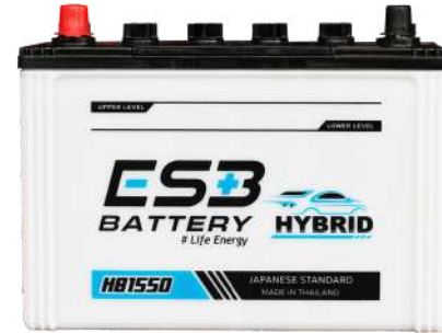
ESB BATTERY HB1550R

REF : 80D31 AMP : 80 CCA : 575 SIZE(mm.) : 173x305x225