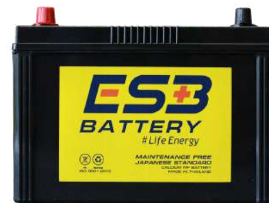
ESB BATTERY MFZ135L

REF : 80D26 AMP : 80 CCA : 580 SIZE(mm.) : 171x258x225