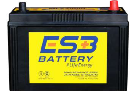
ESB BATTERY MFZ2000L

REF : 85D31 AMP : 85 CCA : 680 SIZE(mm.) : 173x305x225