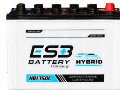
ESB BATTERY HB1750L

REF : 80D31 AMP : 80 CCA : 575 SIZE(mm.) : 173x305x225