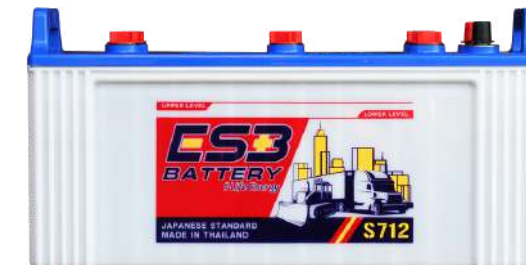
ESB BATTERY S712

REF : N100 AMP : 100 CCA : 540 SIZE(mm.) : 175x315x190