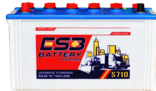
ESB BATTERY S710

REF : 95D31 AMP : 85 CCA : 590 SIZE(mm.) : 173x305x225