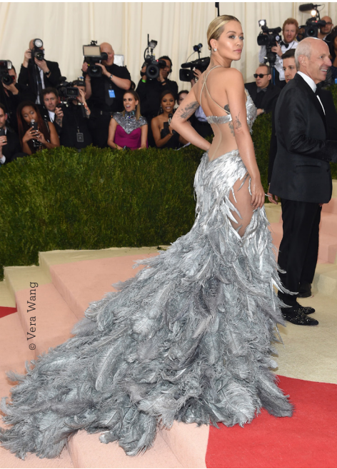
>> Rita Ora dans une création Vera Wang x ECD, MET Gala 2016.

Cependant, une partie de moi n'était pas entièrement satisfaite. Malgré le prestige du lieu, je n'arrivais pas à toucher l'ensemble de la clientèle avec laquelle j'aurais souhaité interagir. C'est ce qui m'a poussé à déménager à Oberkampf, un quartier qui me paraissait plus inclusif et plus diversifié. Malheureusement, je n'y ai pas trouvé mon bonheur.