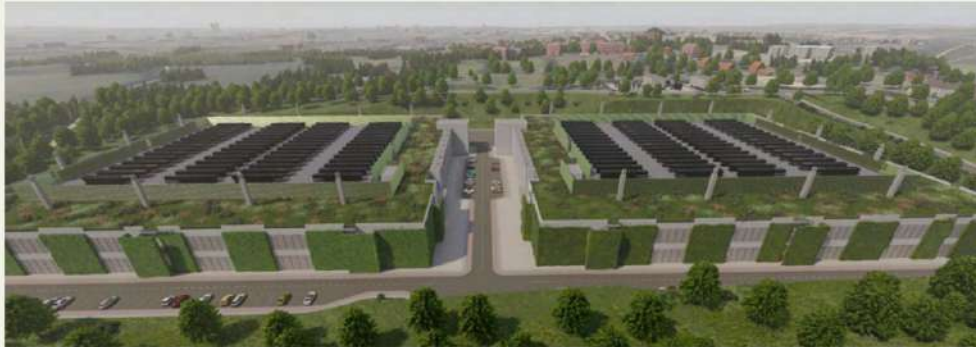
Figure 33 : Projet du campus de data center d'Abbots Langley.

Pour atténuer l'impact visuel, le projet prévoit la création d'une ceinture végétalisée autour du site. Le projet reste toutefois localement perçu comme un grand objet technique imposé, apportant peu de bénéfices visibles au village au regard de ses effets sur le paysage et le cadre de vie.