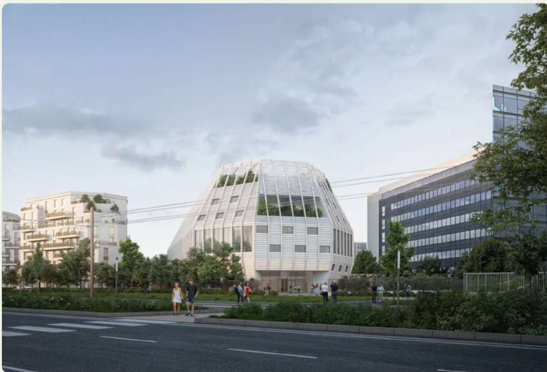
Figure 33 : NDC Vélizy par Silvio D'ascia Architecture. 38

Pascal Thévenot , Maire de Vélizy-Villacoublay.