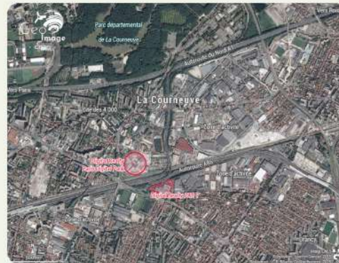
Figure 31 : Paris Digital Park

L'étude d'impact 26 fait apparaître un chantier de dépollution et de terrassement d'ampleur : creusement jusqu'à environ 4 mètres de profondeur, évacuation d'environ 128 000 m 3 de déblais, soit 230 000 tonnes de terres polluées, vers des filières adaptées, puis apport d'environ 1500 t de terres saines et reconstitution de sols propres dans certains espaces verts et autour des canalisations d'eau potable.