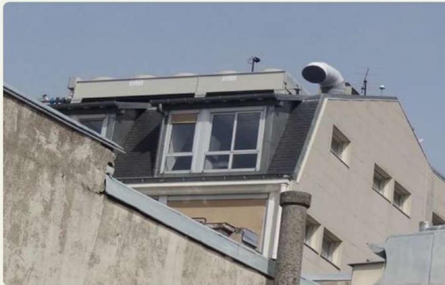
Figure 33 : Système de refroidissement sur le toit de l'immeuble de Zayo 46