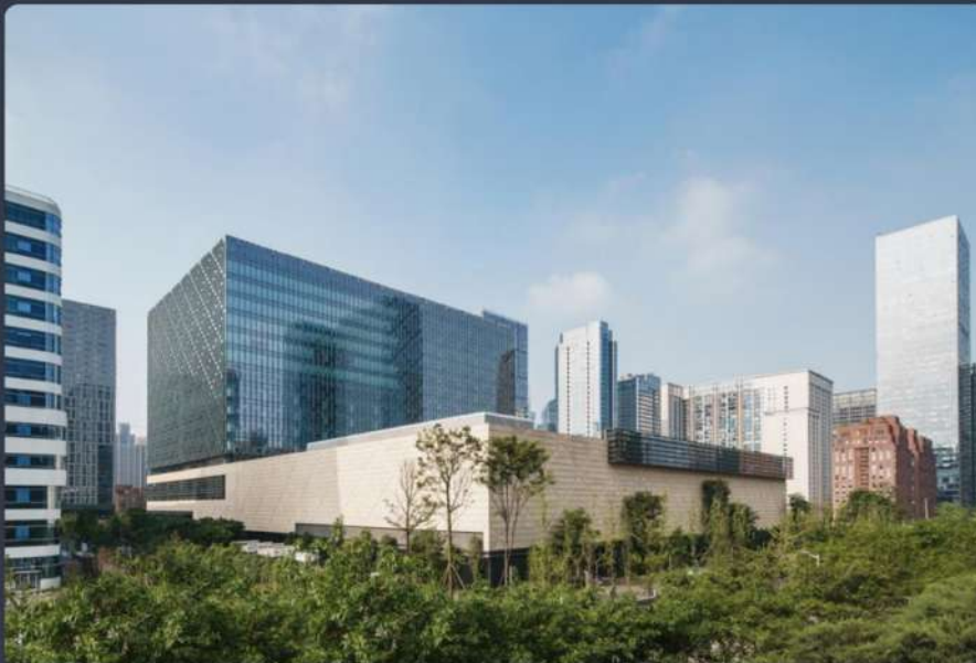
Figure 36 : Data center de Gensler à Chengdu.

Ces exemples montrent qu'une intégration plus hybride est envisageable, mais ils restent ponctuels et éloignés du modèle dominant des grands data centers séparés, en particulier hyperscale .