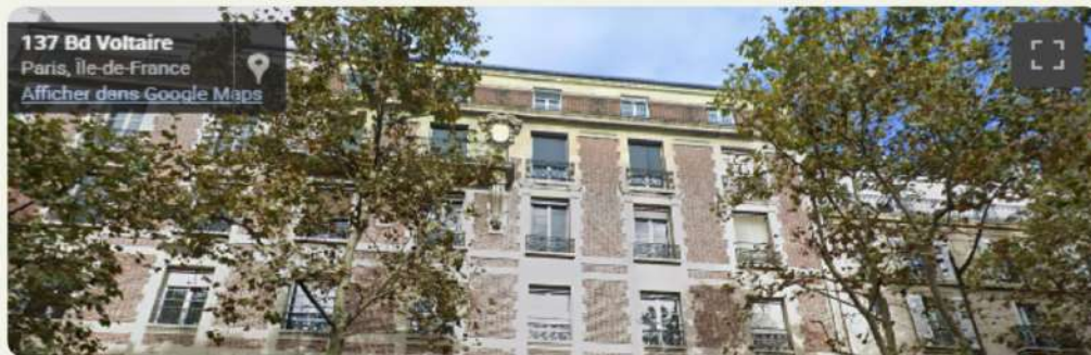
Figure 31 : Data center de Telehouse, Paris 11e