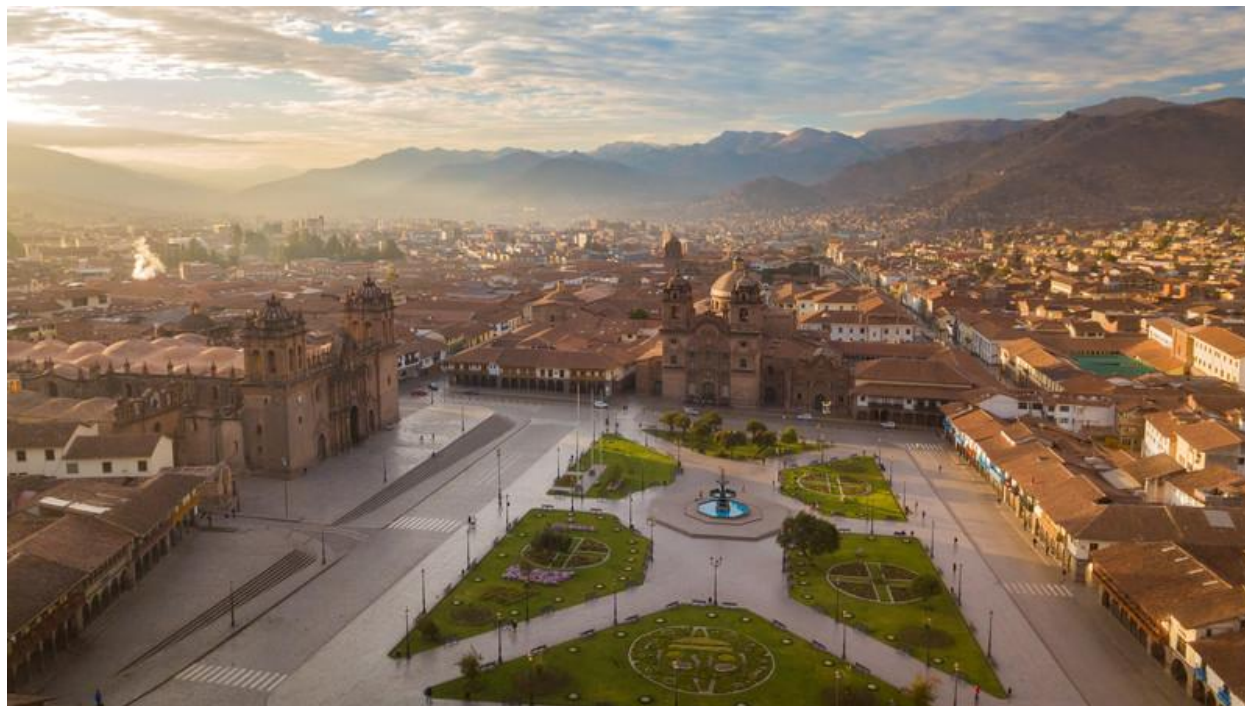
Ziua 5: Valea Sacră a Incașilor

Durata totală a călătoriei astăzi va fi între 2 și 5 ore, în funcție de conexiunile de zbor disponibile. Timpul petrecut în Cuzco poate fi influențat, dar nicio activitate inclusă nu va fi afectată.