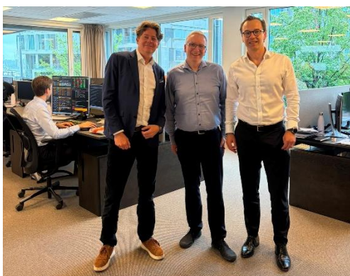
Privates Bild – bei Sissener in Oslo

In der Anlageberatung bieten Hochzinsanleihen ( High Yield ) aus Norwegen, Schweden, Finnland und Dänemark attraktive Möglichkeiten, Portfolios robuster aufzustellen und Erträge abseits des Aktienmarktes zu generieren. Trotz hoher makroökonomischer Stabilität in der Region bieten diese Anleihen oft höhere Risikoaufschläge ( Credit Spreads ) als vergleichbare Papiere in den USA oder Europa.