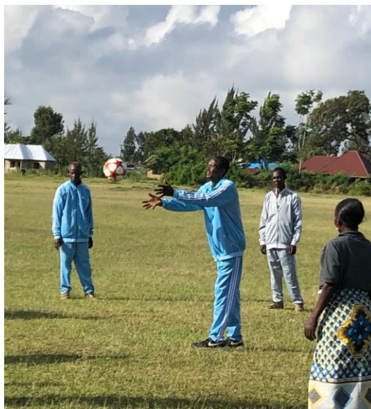
MKUTA leder tidligere tuberkulosepasienter gjennom lungerehabiliteringsøvelser i Mererani (venstre) og Siha distrikt.

Pasientorganisasjonen MKUTA har nå 115 registrerte TB-klubber (lokallag) spredt om i landet - en økning på 40 flere enn i fjor. Alle disse samarbeider tett med de lokale tuberkuloseklinikkene i sine distrikt. Gjennom frivillig innsats bidrar medlemmene ved å gå fra dør til dør i lokalsamfunnet og spre informasjon om tuberkulose og sørge for at de med symptomer får testet seg. Innsatsen MKUTA gjør i lokalsamfunnet er av stor betydning om vi skal finne de mange uoppdagede syke med tuberkulose i Tanzania og bistå de med diagnose og behandling. I 2021 fant de 71 634 personer med symptomer på tuberkulose. Av disse hadde 4 381 hadde tuberkulose (6%).