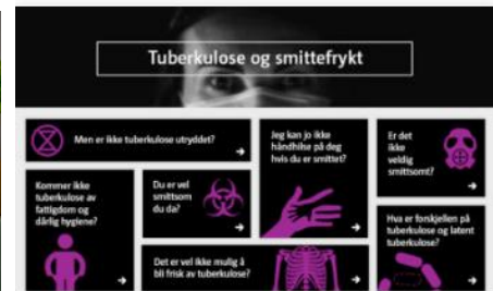
Vårt nye digitale kurs om tuberkulose og smittefrykt brukes bl.a. i hjemmetjenesten.

Undervisning og talsmannsarbeid: Det å gi informasjon og å fremme brukerperspektivet overfor helsevesenet, offentlig ansatte som jobber med risikogrupper, samt beslutningstakere er sentralt for oss. Arbeidet med oppfølging av pasienters psykiske helse har i perioden vært en viktig del av dette. I perioden har vi også deltatt i i møter i nettverkene til FHI Migrasjonshelse. Her har mye av fokuset vært på korona, og erfaringene våre med tuberkulose har vært nyttige å bringe inn.