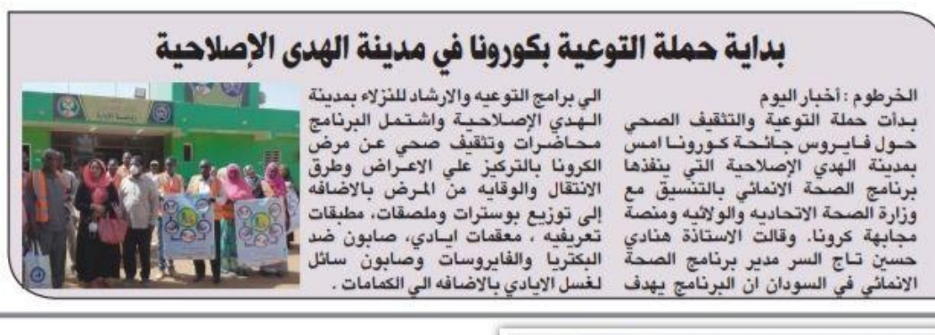
HDP har oppnådd mye mediaomtale i 2021

I tillegg til å være del av den nye femårige planen med Norad fra 2021, er HDP også en partner i prosjektet om ettervirkningene av TB – eller «post-TB disability». Prosjektet skal foregå i to bydeler av Khartoum state og bygger på tilnærmingen som er brukt i Malawi. Dette inkluderer blant annet mobilapp på arabisk, etablering av to «Post-TB friendly» klinikker og opplæring i inkluderende helsekommunikasjon. På tross av litt forsinkelser pga pandemi og at det ikke var mulig med prosjektbesøk i 2021 er prosjektaktivitetene godt i gang og vel tatt imot. Behovene er store.