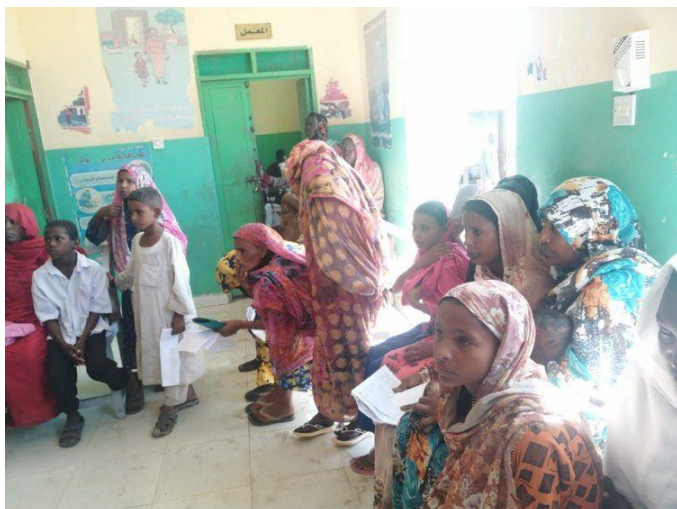
Besøkende til en mobil klinikk i Blue Nile State

Sudan har fått økende flyktningstrømmer (pga. grensekonflikt med Etiopia) og internt fordrevne (grunnet konflikter i Darfur og Øst-Sudan), noe som gjør både TB- og Covid-19 situasjonen uoversiktlig. HDP ble bedt av myndighetene om å bistå i å informere om Covid-19. HDP har blant annet vært aktive i flyktningleire og i fengsler, og fått folk med symptomer til å teste seg – både for Covid-19 eller TB.