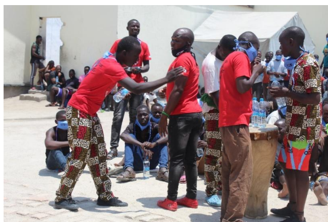
Likemann gjennomfører TB-screeningene (til venstre) og har en sketsj om TB og Covid-19 – «gateteater» for de andre innsatte