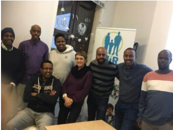
Fra et av informasjonsmøtene om tuberkulose og korona.

Vi har også samarbeidet med andre organisasjoner som jobber med innvandrerhelse og inkludering av innvandrere. Dette er viktig, både for å nå flere brukere, å spre tuberkuloseinformasjon blant andre som jobber med målgruppene og å lære av hverandre. Vi har bl.a. hatt et organisert samarbeid med erfaringsutveksling med Primærmedisinsk Verksted, For Fangers Pårørende, Tverrkulturell helseinfo og Mir (Mangfold, Inkludering, Respekt). Sammen med de to sistnevnte organisasjonene arrangerer vi Helsefestivalen, som i 2021 sto bak et digitalt seminar om åpenhet, tillit og smittefrykt.