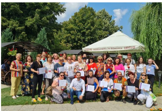
Glade deltakere (og glade trenere) etter helsekommunikasjonskurs i Curtea de Arges og Buzau