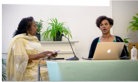
Personlig historie om korona under Helsefestivalen