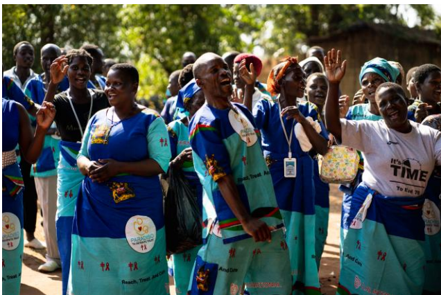
Bildet viser tidligere tuberkulosepasienter, nå frivillige medlemmer av pasientorganisasjonen Paradiso.

Våre malawiske partnere har fått til mye i 2021, til tross for pandemi og stor prisvekst på alt fra matvarer til bensin, strøm og vann. Pasientorganisasjonene Paradiso har jobbet på spreng for å spre god informasjon om både TB og Covid-19, de har screena for symptomer og henvist til helsehjelp. Personer som tester positivt for tuberkulose blir videre hjulpet gjennom behandlingen av frivillige i Paradiso. De sju distriktene som Paradiso er aktive i sto for 33,5% av alle registrerte TB tilfeller i landet (28 distrikter totalt). Dette viser hvor viktig deres arbeid er for å finne de som er syke og sørge for at de får helsehjelp. Behandlingsresultatene i de områder hvor Paradiso er aktive er også mye bedre enn resten av landet, med 96,4% mot 88%.