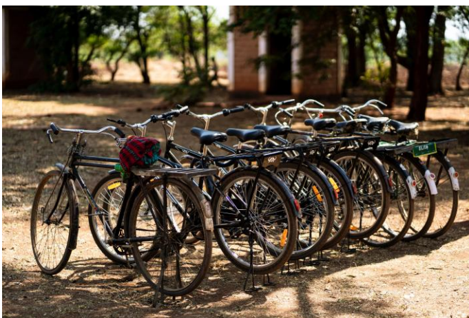
Frivillige i Chilobwe TB club sykler til pasienter for oppfølging og til samlinger og møter.

Våre malawiske partnere har fått til mye i 2021, til tross for pandemi og stor prisvekst på alt fra matvarer til bensin, strøm og vann. Pasientorganisasjonene Paradiso har jobbet på spreng for å spre god informasjon om både TB og Covid-19, de har screena for symptomer og henvist til helsehjelp. Personer som tester positivt for tuberkulose blir videre hjulpet gjennom behandlingen av frivillige i Paradiso. De sju distriktene som Paradiso er aktive i sto for 33,5% av alle registrerte TB tilfeller i landet (28 distrikter totalt). Dette viser hvor viktig deres arbeid er for å finne de som er syke og sørge for at de får helsehjelp. Behandlingsresultatene i de områder hvor Paradiso er aktive er også mye bedre enn resten av landet, med 96,4% mot 88%.