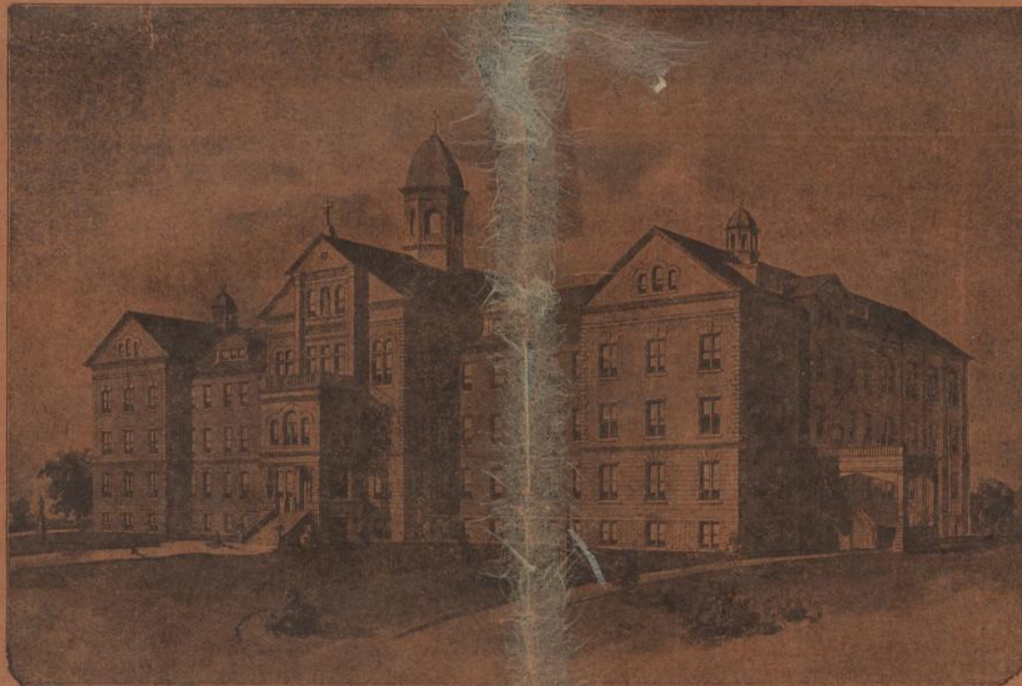
Accademia Di Santa Agnese

Le Suore di Santa Agnese servirono quali angeli confortatori durante tutte le epidemie della febbre gialla. Senza paura e conscie dei loro doveri esse andavano e venivano a tutte le ore dove maggiormente era richiesta l'opera loro. Esse erano conosciute in tutti i distretti della città; la loro missione di carità guadagnò loro reverenza e ammirazione.