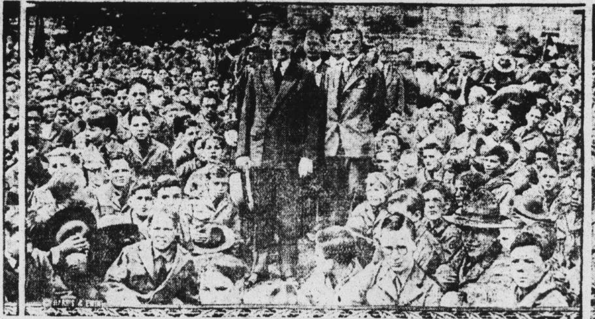
President Coolidge, who is honorary president of the Boy Scouts of America, greeted over 2,000 of the scouts at the White House. The scouts were in Washington attending the sixteenth annual convention of the national council.