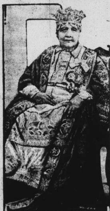
Her Majesty's Highness Sultana Jehan, begum of Bhopal, only woman ruler of an independent Indian state, photographed in her royal robes on her visit to London