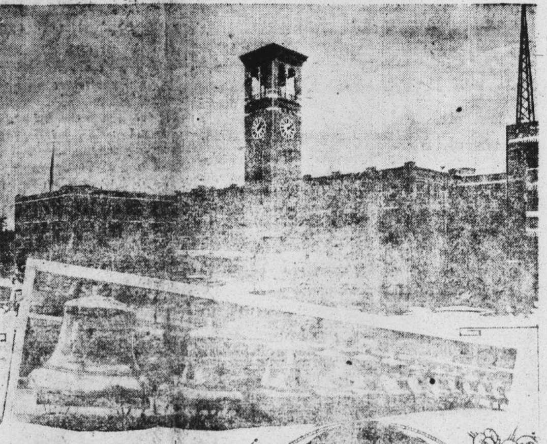
Station WSAI of the United States Playing Card Company at Cincinnati, is among the outstanding broadcasting stations of the country; it is up with the leaders in power, for it has a 5000 watt Western Electric equipment. And it is among the leaders in quality of entertainment, for it is teaching the nation to play bridge by radio.

The plan is to have four experts play a deal of Auction Bridge and to broadcast each bid and each play of the deal, together with the reasons for each bid and each play. Prior to each broadcasting, listeners-in are informed as to the names of the participants so that on the night of the game any four may play the deal, and each player be named after one of the four experts and take the same relative position at the table as that occupied by his expert namesake. The result of the draw for partners and deal is announced, and then the cards dealt to each expert. The bidding then follows, after which each play is announced so that the players can play the same cards that the experts do. The bell tower of the plan in which