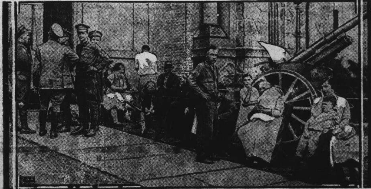
As a result of the explosions and burning of the United States naval ammunition depot at Lake Denmark, near Dover, N. J., many families were forced from their homes. The photograph shows some of the refugees at the almshouse in Morristown, N. J., where they were cared for.