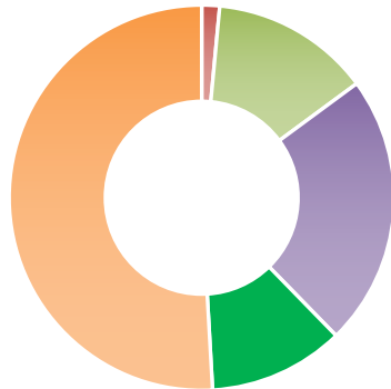
Bundesdeutscher Strommix 2025