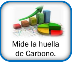
Mide la huella de Carbono.