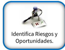
Identifica Riesgos y Oportunidades.

Identificar los riesgos y oportunidades de sostenibilidad que podrían tener impactos tanto positivos como negativos en CYDSA.