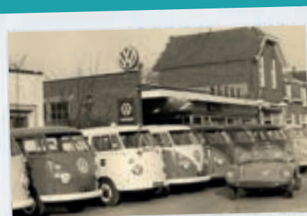
Opgericht in 1935

Bij de TCR Groep werk je niet alleen voor een groot en dynamisch bedrijf, maar ook binnen een hecht en professioneel team waar samenwerking en respect voorop staan. We bieden volop mogelijkheden om te groeien en jezelf te ontwikkelen, met opleidingen en ondersteuning vanuit de TCR Academy. Hier doen we wat we zeggen, staan we samen sterk en geloven we dat een goede sfeer op de werkvloer zorgt voor blijde medewerkers en tevreden klanten. Kies voor een werkgever waar jouw inzet écht telt en waar je een verschil kunt maken!