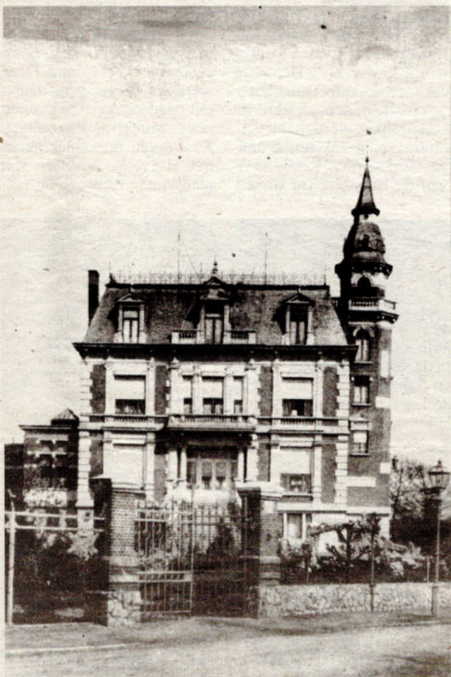
Kasteel De Galg