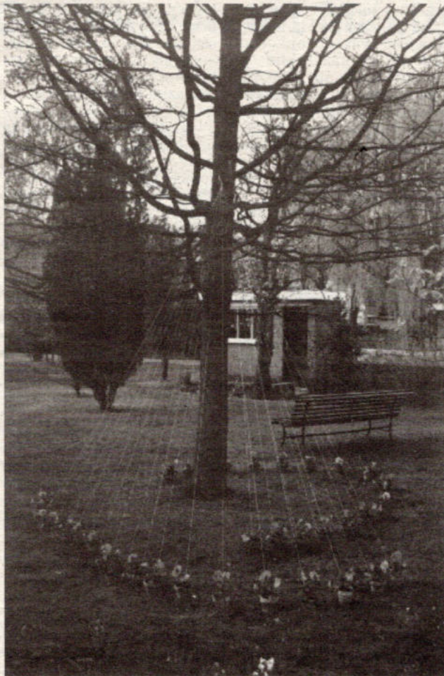
De eik, die 20 jaar geleden bij de oprichting werd geplant, werd versierd met viooltjes.

De verklaring van het Hebrreeuwse TSEDEK maakt onmiddellijk duidelijk wat het centrum reeds 20 jaar doet: mensen tot hun recht laten komen. Ouderen en jongeren met een emotioneel probleem waarvoor meer opvang nodig is dan men thuis kan geven, maar waarvoor een opname in de psychiatrie te zwaar is, vinden er een thuis. Aan de Bist, midden in Sint Maria burg, biedt dit psycho-sociaal revalidatiecentrum plaats aan een twintigtal mensen die gedurende de enkele maanden met een persoonlijke begeleider proberen hun problemen aan te kunnen.