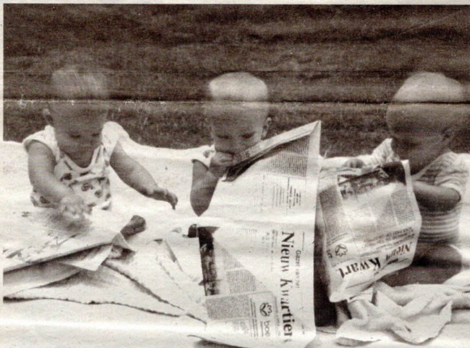
Onze jongste lezertjes