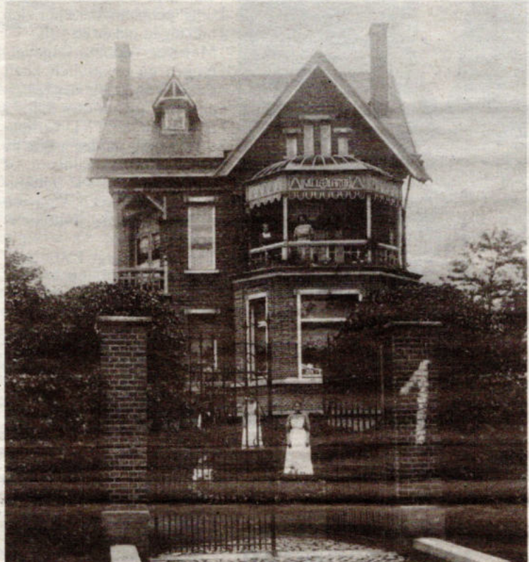
Waar stond dit typisch Mariaburgse landhuis?