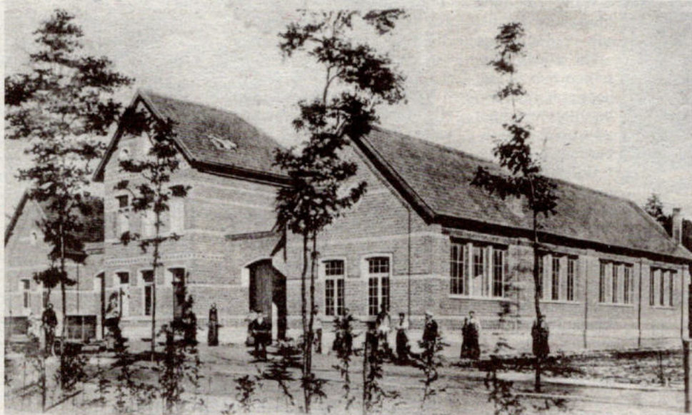
Vue sur les ateliers de construction, Avenue Chapelle-au-Bois à St. Mariaburg.

bouwd waar het onderricht door de heer Jaak Matthijssen gegeven werd. Het jaar