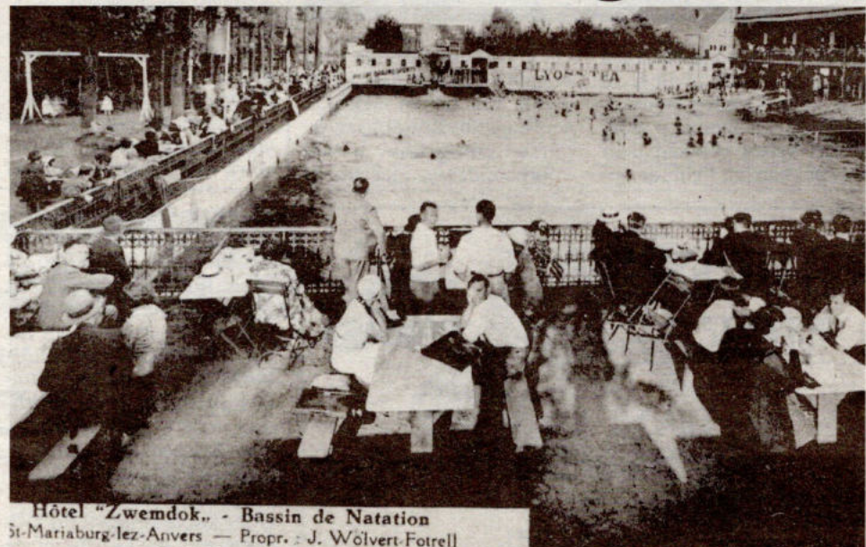
Hôtel "Zwemdok" - Bassin de Natation St-Mariaburg-lez-Anvers - Propr.: J. Wólvert-Fotrell

Voor een verfrissende duik op een zomerse dag was je vroeger niet aangewezen op het zwembad van Brasschaat of de kust. Je kon er in ons eigenste Mariaburg voor terecht. "De Zwemdok" dateert reeds van 13 mei 1900. In de aanvangsjaren was het hier regelmatig een overrompeling. Maar ook gedurende de dertiger jaren was het succes van het zwembad nog steeds overweldigend. Na de oorlog echter kwam al spoedig de aftakeling tot alles in 1973 met de grond gelijk werd gemaakt.