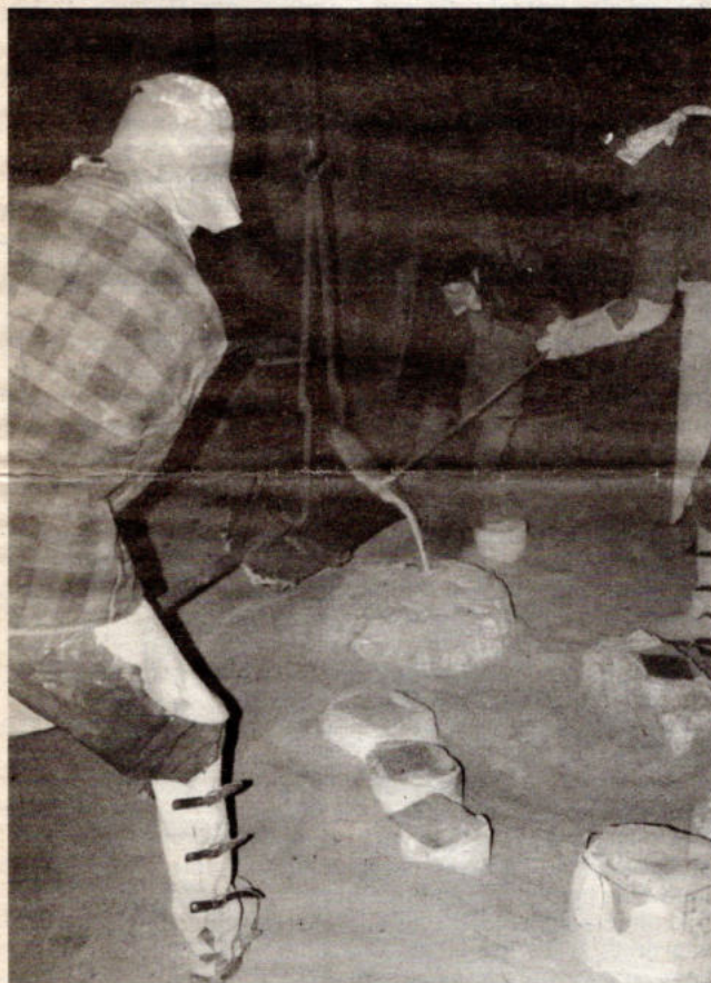
Werken met brons is bijwijlen spectaculair

Onthulling Met de inhuldiging van het kunstwerk wordt een buitengewoon en uniek feestjaar afgesloten. Iedereen wordt uitgenodigd om de onthulling van het beeld mee te maken op zondag 16 november om 14u30 aan het plein op de hoek van de St.-Antoniuslei en de Jacobuslei. In aanwezigheid van het bestuur van de gemeente Braschaat en van de kunstenaar zal het beeld plechtig worden onthuld. Van harte welkom.