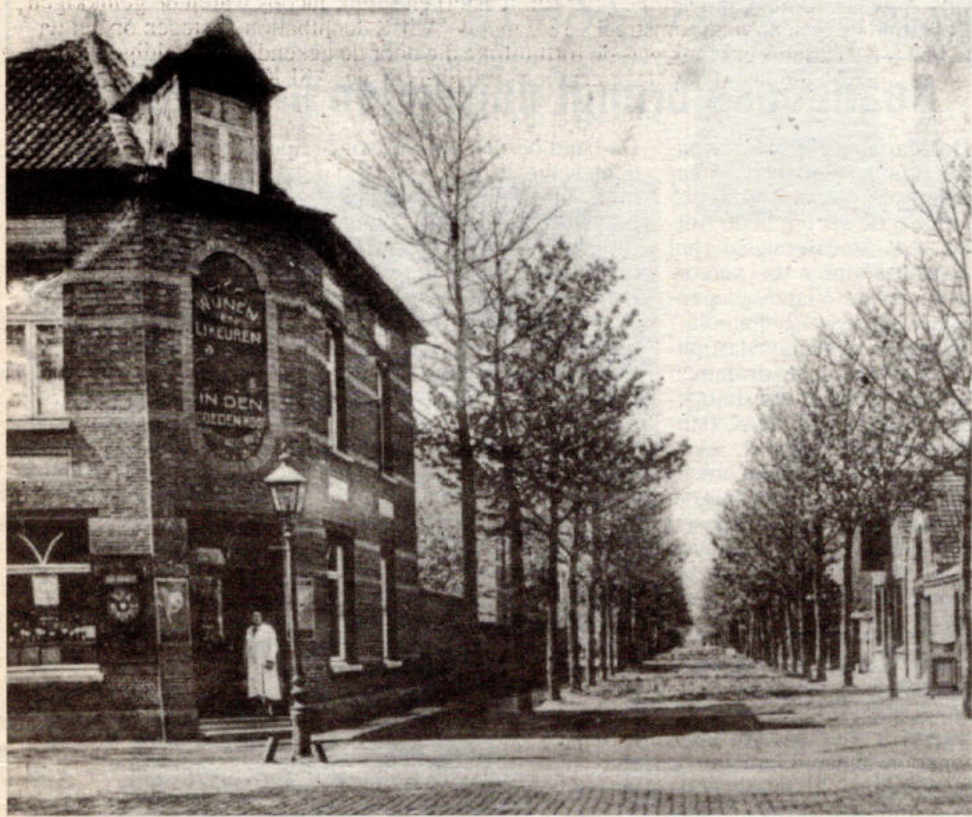
"100 jaar St-Mariaburg" en een oude foto van de winkel sierden het etiket van de wijnfles.

Enkele prijzen ter vergelijking: een fles pastoorwijn kostte 1,25 fr., sherry 2 fr.; cognac 2,50 fr., Advocaat 3,50 fr., Benedictine 9,50 fr., Elixir d'Anvers 2,80 fr.,