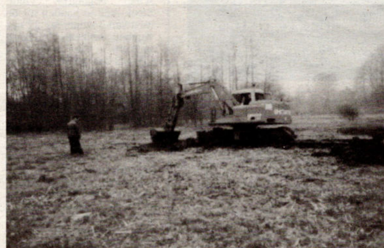
Een steen in de kikkerpoel?

Door verlanding en vervuiling ging de put achteruit als biotoop voor deze dieren. Daar is nu gelukkig verande-