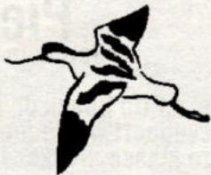
De Kluut is het symbool van Natuurreservaten

zodat het ontsluiten van de gronden een meerwaarde heeft voor de gemeenschap.