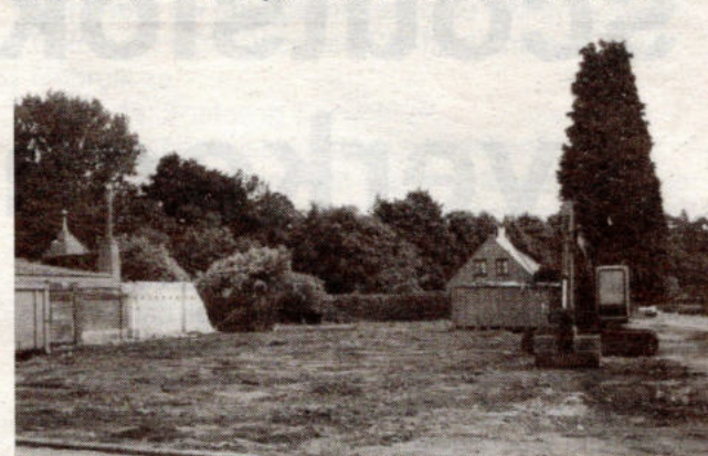
Van het Zwemdok en aanpalende gebouwen blijft alleen een desolate vlakte over

Wat er op de gronden aan de Charlottalei zal komen, weet niemand. Blijkbaar zijn de percelen niet diep genoeg om aan de verkavelingsvoorwaarden te voldoen. "De gebouwen hadden kunnen behouden blijven en gerenoveerd voor bejaardenflats, waaraan een grote behoefte is in de wijk," stelde een buurtbewoner.