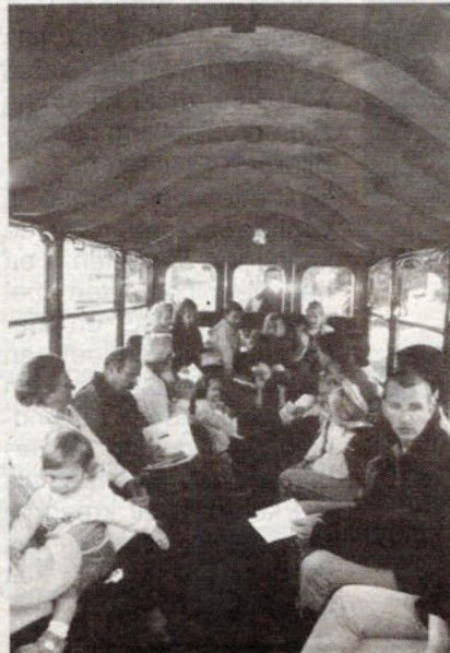
De paardentram voerde heel wat geïnteresseerden door de straten van Sint-Mariaburg.

Het Tracé-treintje voerde een grote groep geïnteresseerden langs een 13 locaties in de wijk, waar ze konden ervaren dat de cultuurraad van het district Ekeren voor een uitzonderlijk hoogstaand gebeuren zorgde. De verdiensten van meewerkende kunstenaars als