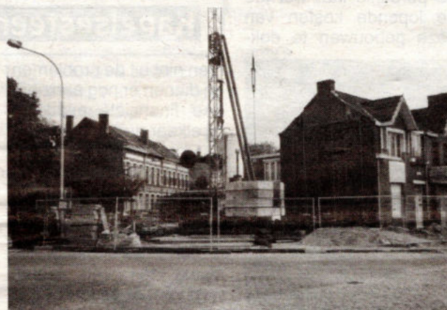
Denver International NV bouwt een nieuw bedrijfskantoor op de plek waar vroeger kruidenierswinkel "In de Boerendochter" stond.

lei - een onderdeel van het Zwemdokcomplex en café "In den Bastiaan" - ligt nu een lege woestenij. Op de Kapelsesteenweg is rechtover de Katerheidemolen het sierlijk huisje achter het Antolbenzinstation weggeveegd. Naast café De Tramhalte (hoek Vrijwilligerslei-Kapelsesteenweg) zijn de ruïnes van de vroegere rijwielhandel gesloopt. De achterkant van de Heyman-houtzagerij tussen Boskapellei en Henrilei is ge-