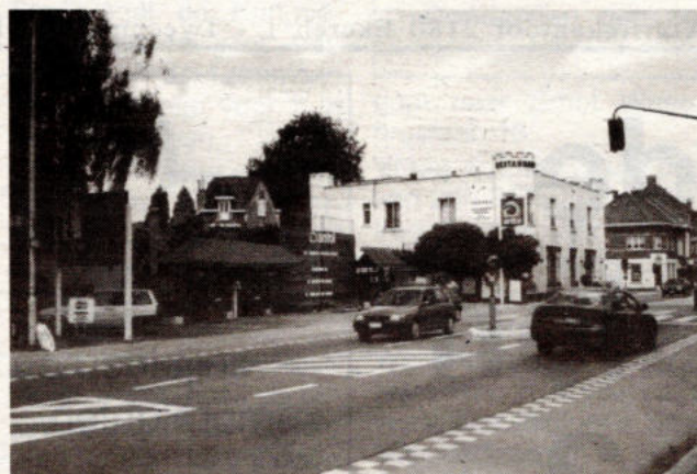
Het mooie villaatje over de Katerheidemolen is gesloopt om benzinstation Antol te vergroten.

De bulldozers en graafmachines waren in de wijk bijzonder actief vlak voor het bouwverlof. Een aantal nieuwe kraters bleken het resultaat. Waar zich de werkhuizen van Antverpia bevonden aan de Charlotta-