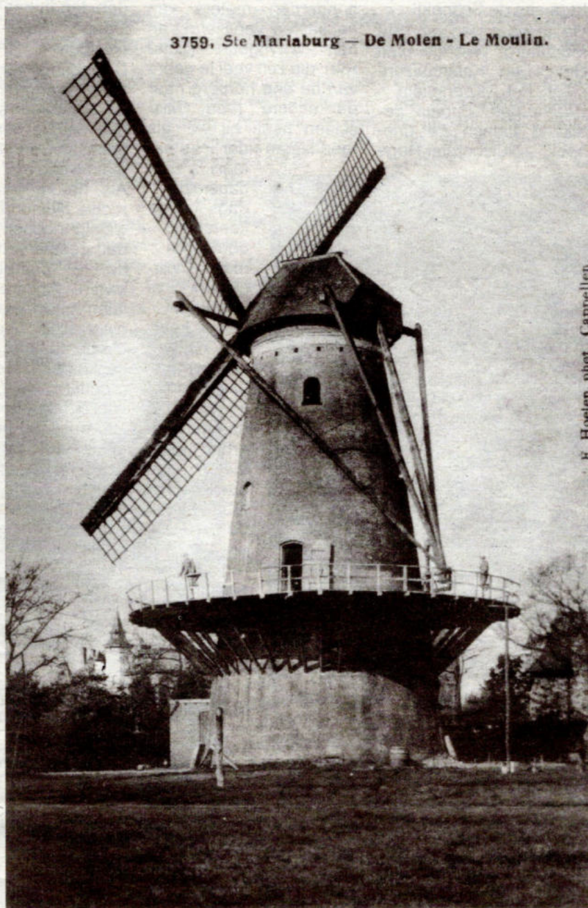
De Katerheidemolen in betere tijden. Jammer toch dat dit historisch gebouw zijn kap en wieken kwijt is! Kan er van overheidswege geen initiatief genomen worden om de molen in zijn oude glorie te herstellen?