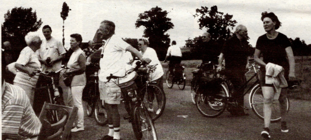
Jong en oud, héél Mariaburg op de fiets voor de Velo Classic 2000.