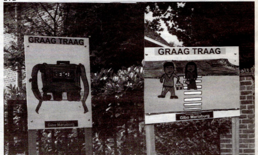
Leerlingen van Gibo Mariaburg maakten kleurrijke borden "Graag traag" om aandacht voort de veiligheid in de buurt van de school te vragen.