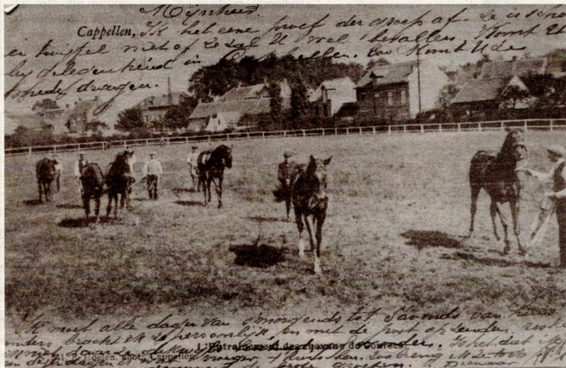
Op deze oude postkaart van Kapellen ziet men hoe de volbloeden getraind werden voor de koersen