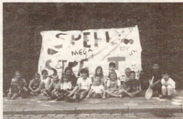
Een groepje kinderen poseert fier voor het doek "Speelstraat" dat ze zelf geschilderd hebben.