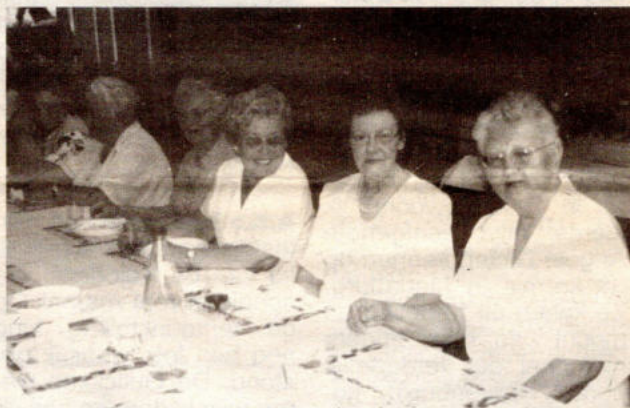
Alle omwonenden werden bij het gebeuren betrokken en zelfs de avondlijke regen kon de vreugde niet bederven: in het zaaltje van Geenen kon men verder vieren.