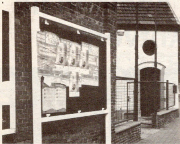
De gemeentelijke aanplakborden mogen geen mannekenblad worden...

We hebben het probleem meermaals aangekaart en suggesties voorgedragen: de Mariaburgse jeugd en ook andere verenigingen vroegen om aanplakborden, waarop ze hun affiches kwijt konden. Zo zou een einde komen aan het sluiplakken op alle mogelijke palen en elektriciteitskasten, wat telkens tot vervolging en penalitatie door de politie leidde.