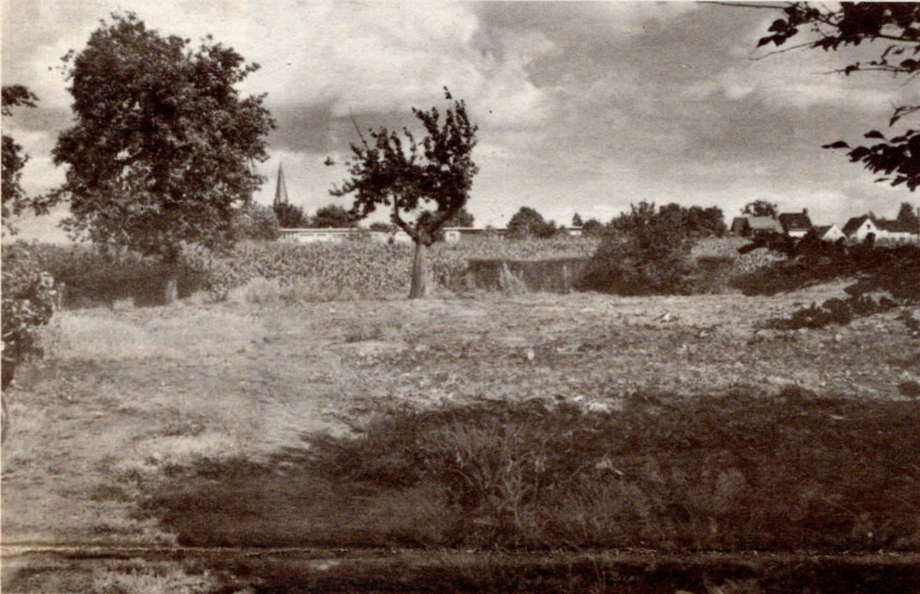
Op deze plek stond tot voor kort een hoevetje temidden van de maïsvelden en de weilanden die een groene buffer vormen tussen Puihoek en Sint-Mariaburg

Het oude hoevetje temidden van de velden over de spoorweg (recht over de Gerarduslei) werd op een zondagmorgen plots gesloopt en het gerucht liep dat de eigenaar er een nieuwbouw zou optrekken. Gelijktijdig werd de herprofilering van de straat Puihoek, tussen Klein Heken en Schriek,