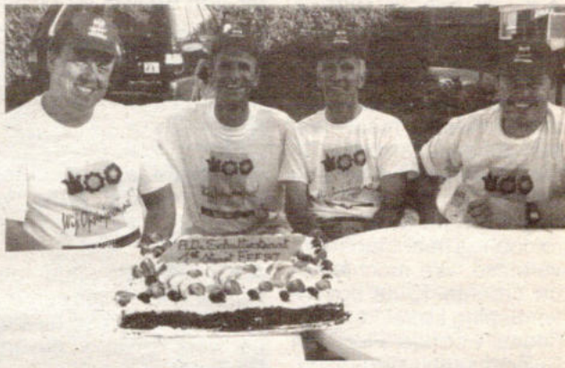
Het eerste straatfeest in de Alfons De Schutterstraat werd met een barbecue ingezet en "baker" Bullen zorgde voor een prachtige feesttaak. Dat de stemming er meteen goed inzate bemerkten aan de shirts "Wij Opsinoren mee!" van de blije vaders