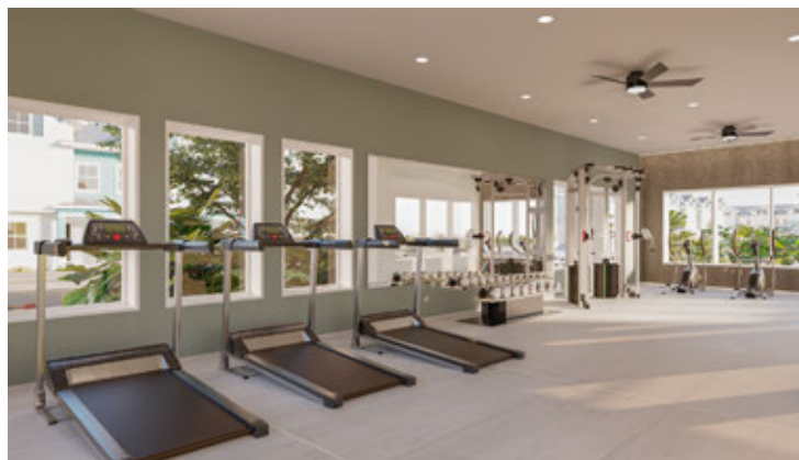
Academia comunitária *Renderização digital