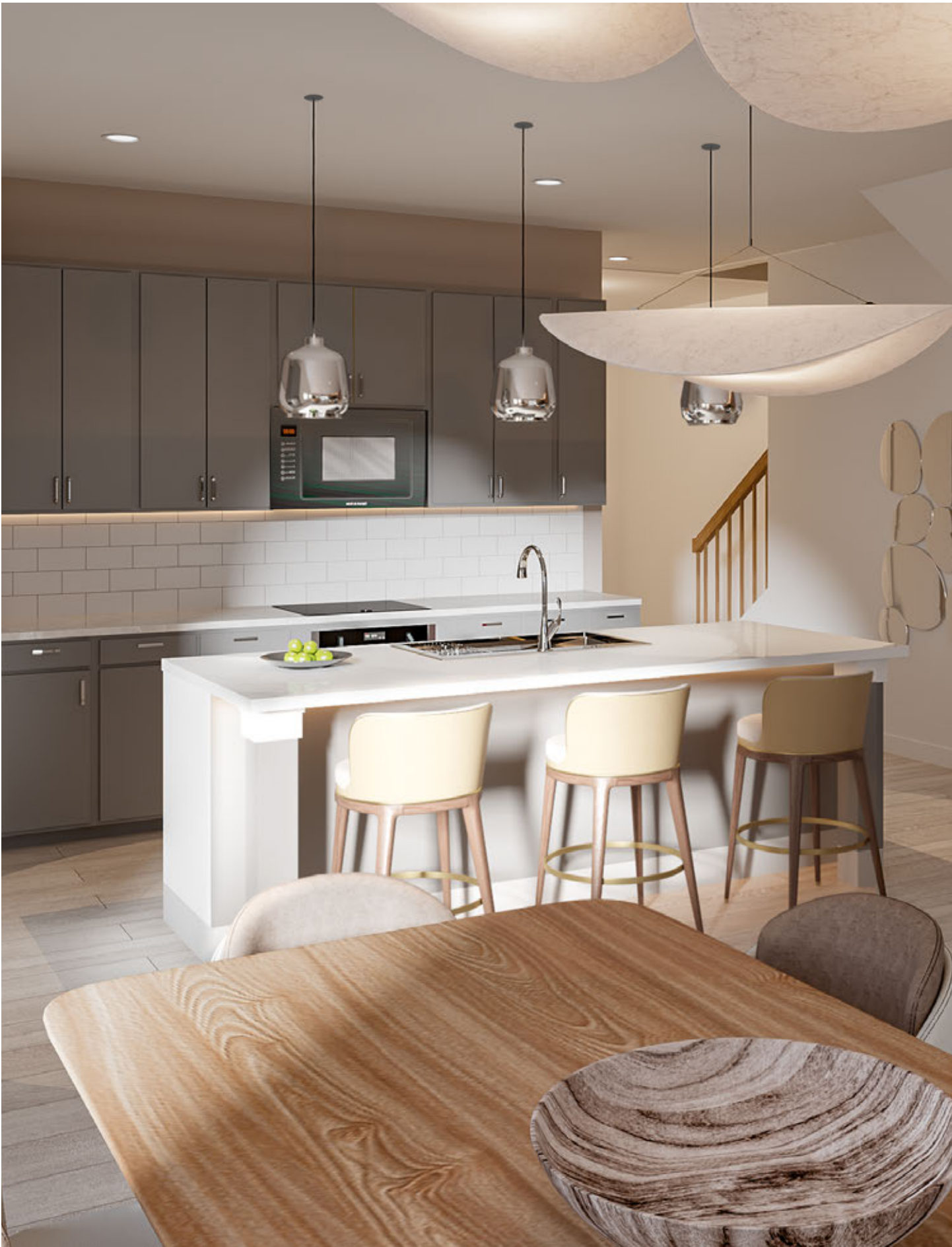
12 POSNER RESERVE