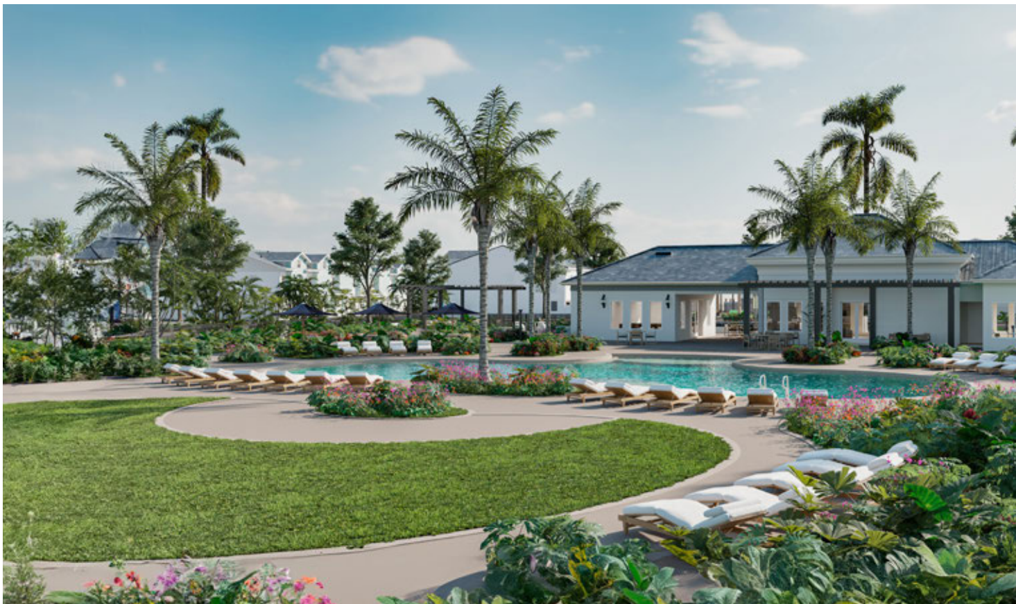
Exterior e deck da piscina *Renderização digital