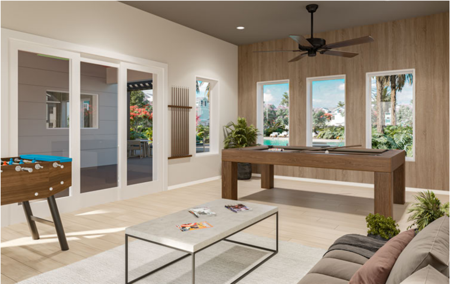
Sala de jogos do Clubhouse *Renderização digital