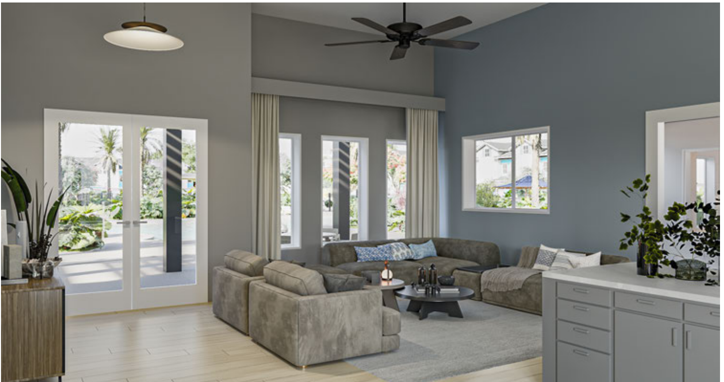
Entrada do Clubhouse *Renderização digital