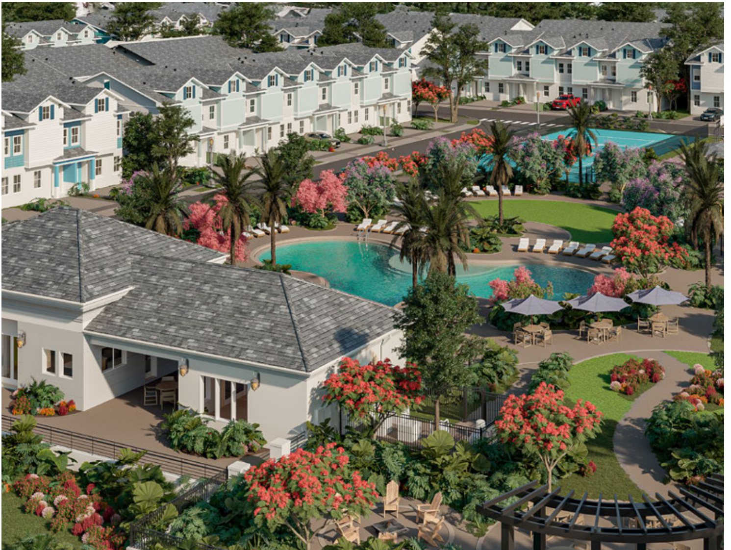
Vista aérea da comunidade *Renderização digital