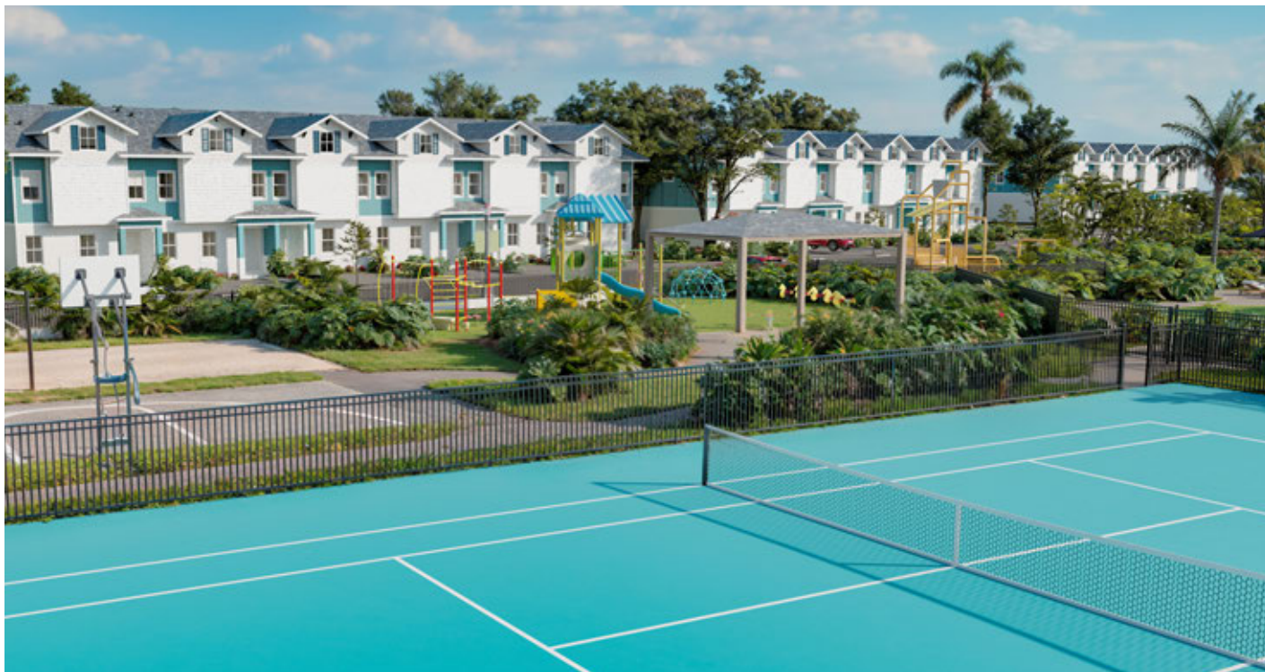
Quadras de tênis / pickleball *Renderização digital