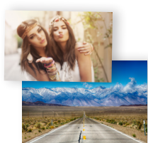
Tirages 10x15 & 20x30