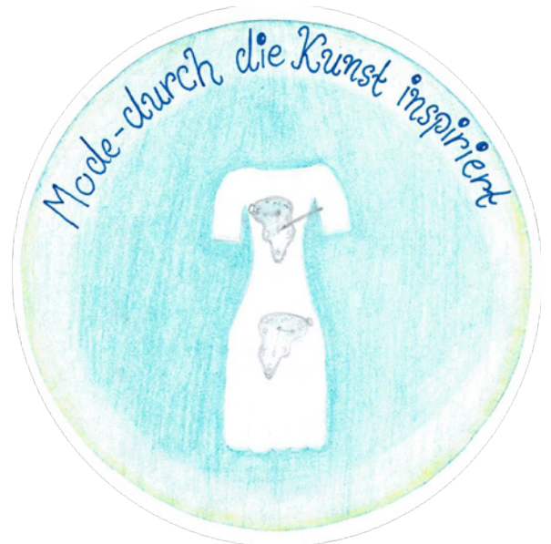
Lina Selle: Mode - durch die Kunst inspiriert