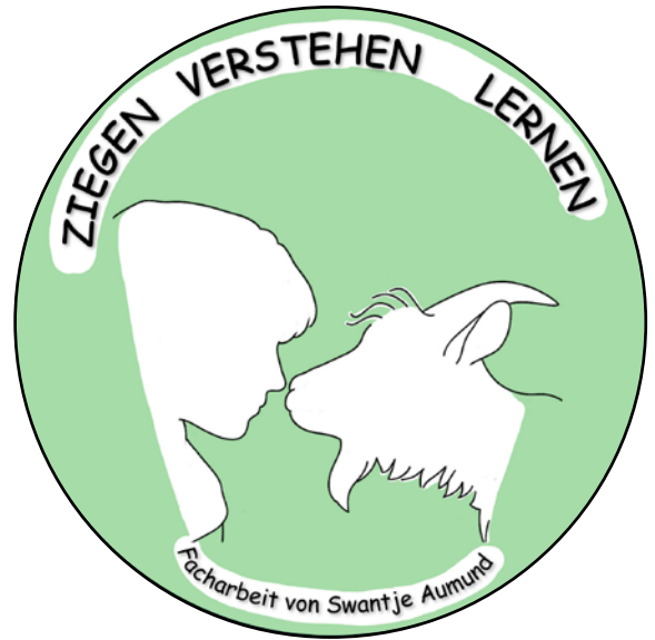
Swantje Aumund: Ziegen verstehen lernen