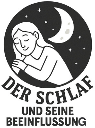
Eva Ross: Der Schlaf und seine Beeinflussung