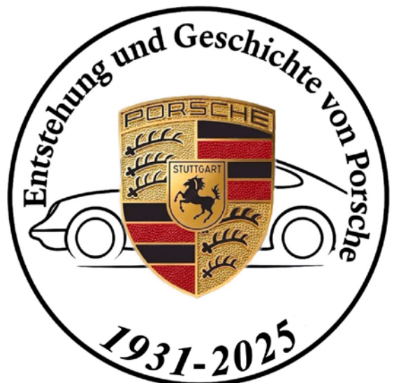
Jannis Fischer: Entstehung und Geschichte von Porsche