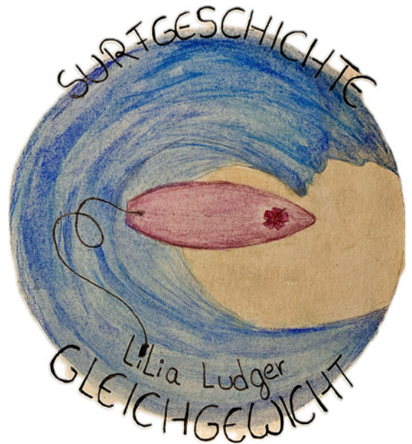
Lilia Ludger: Surfgeschichte - Gleichgewicht