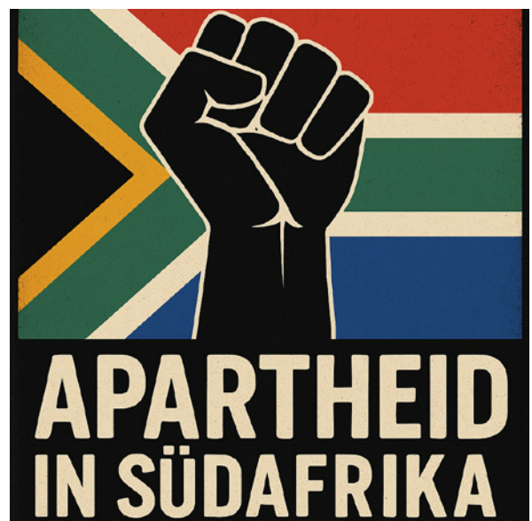
Demba Diéne: Apartheid in Südafrika