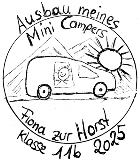
Fiona zur Horst: Ausbau meines Mini-Campers