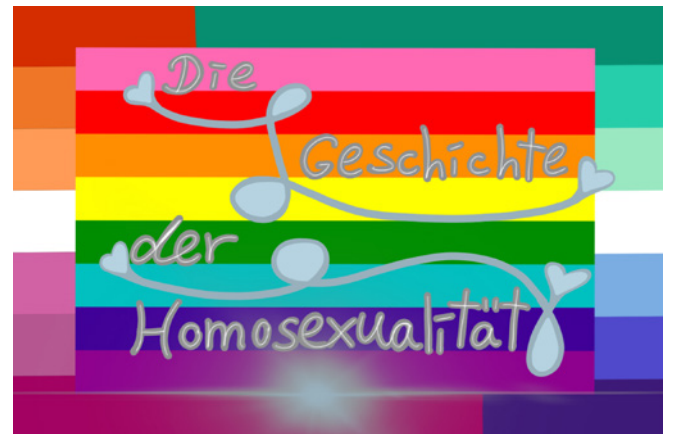
Finja Mochalski: Die Geschichte der Homosexualität