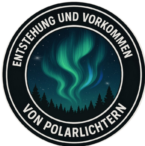
Leonie Goldner: Polarlichter