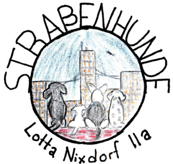
Lotta Nixdorf: Straßenhunde