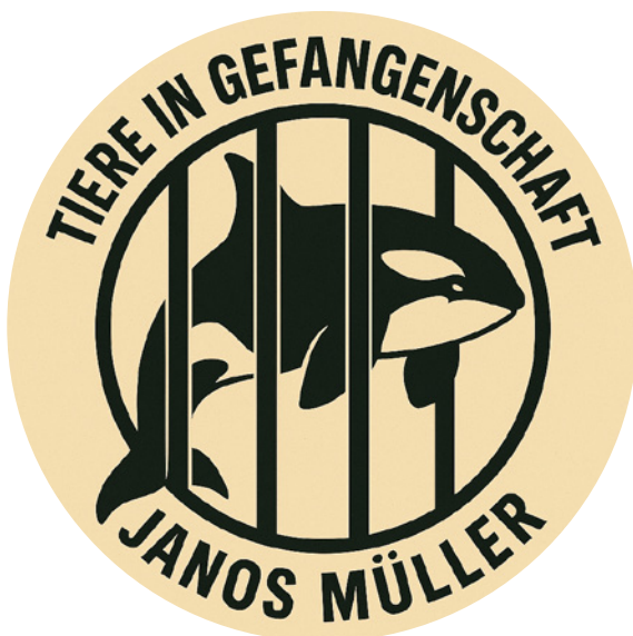
Janos Müller: Tiere in Gefangenschaft