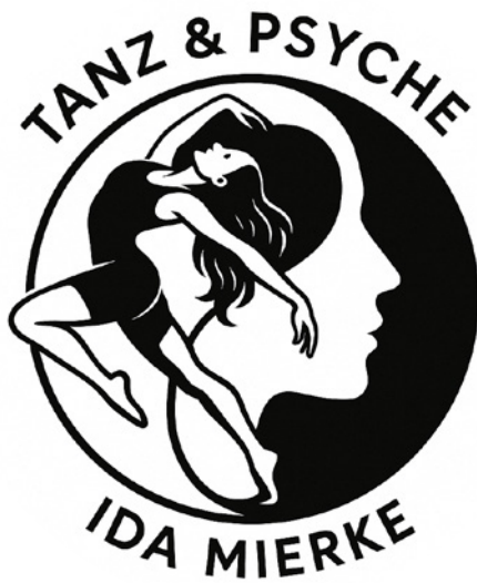
Ida Mierke: Tanz und Psyche