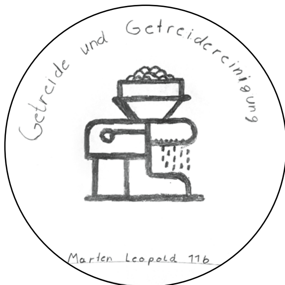
Marten Leopold: Getreide und Getreidereinigung