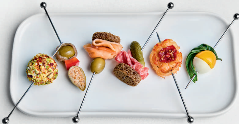
Шпажка сырный шарик / лосось, оливка, хлеб / оливка, анчоус, перчик / салями, соленый огурец, ржаной хлеб / лангустин, вяленый черри / капреччино