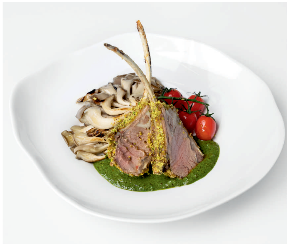
Каре ягненка с фисташками и гремалатой