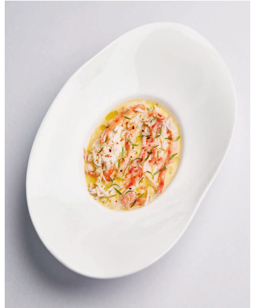
Фаланга краба, крем из кукурузы