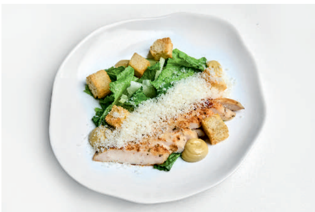
Салат с цыпленком и пармезаном