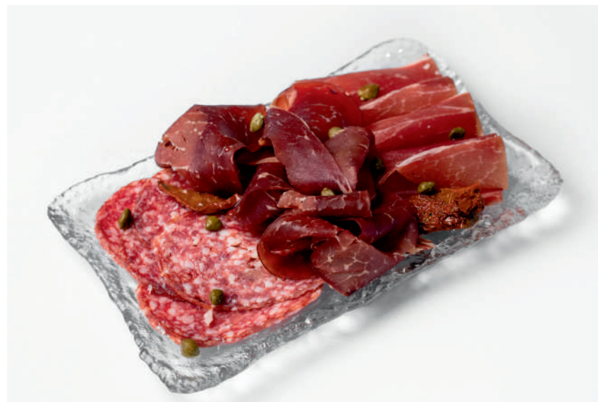
Мясные деликатесы сыровяленные