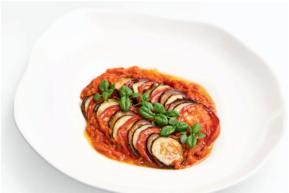
Тиан из овощей (Рататуй)