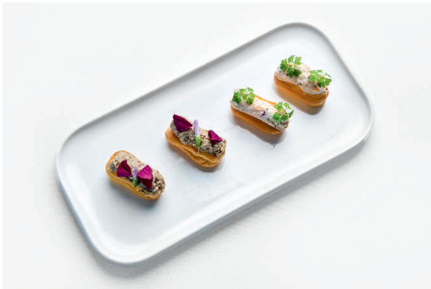
Мини эклеры, рьет из лосося Мини эклеры, грибной паштет