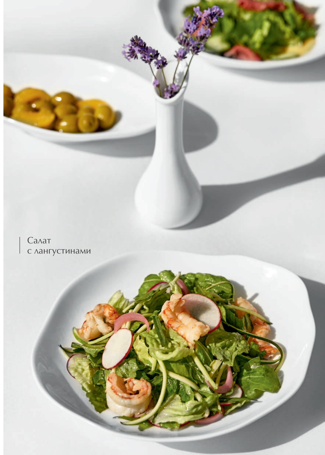
Салат с лангустинами