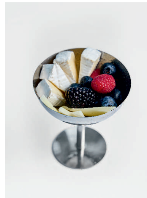
Креманка с сырами и ягодами