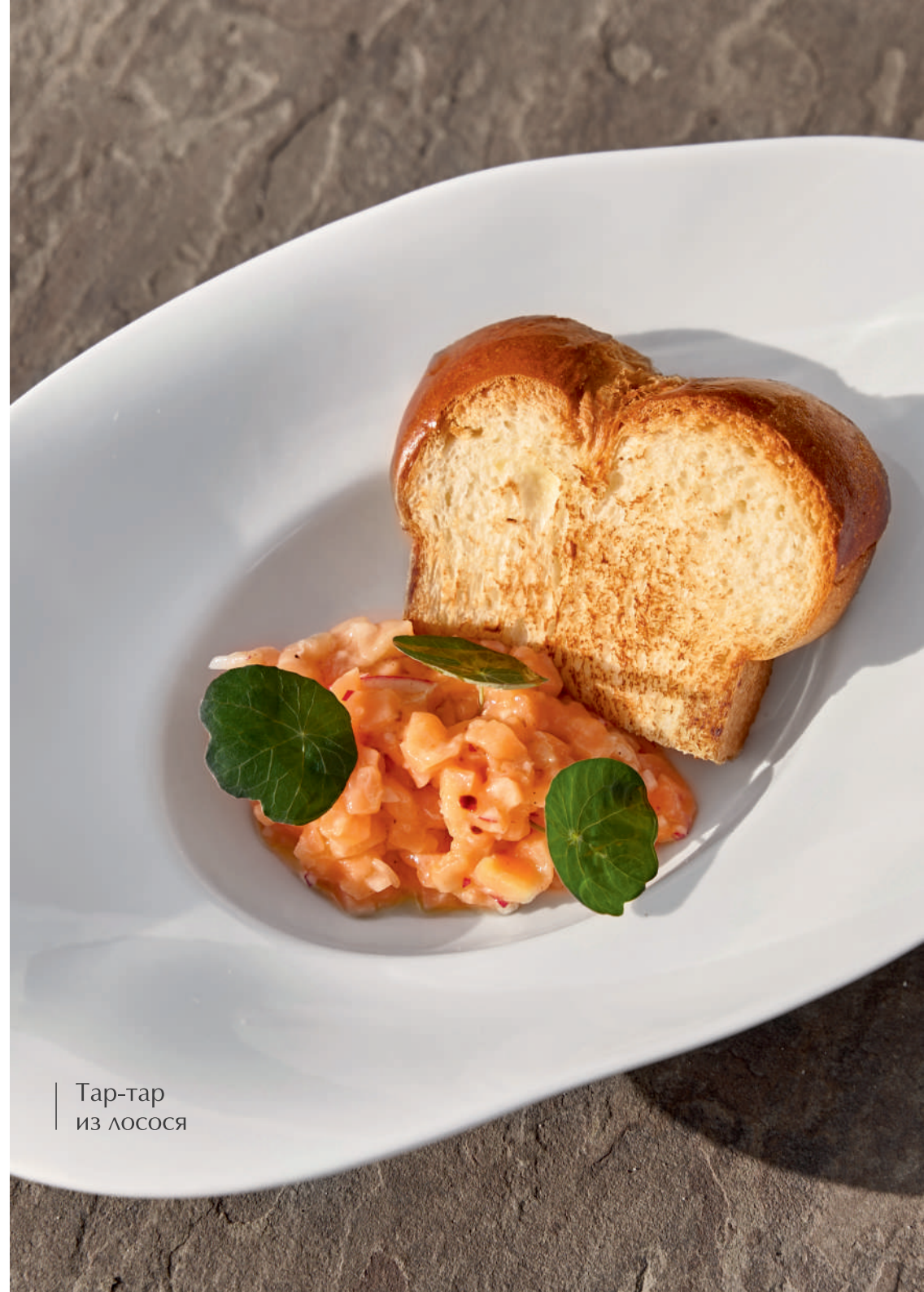
Тар-тар из лосося