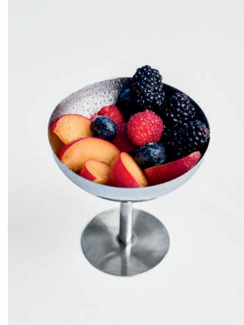
Креманка с сезонными ягодами и фруктами