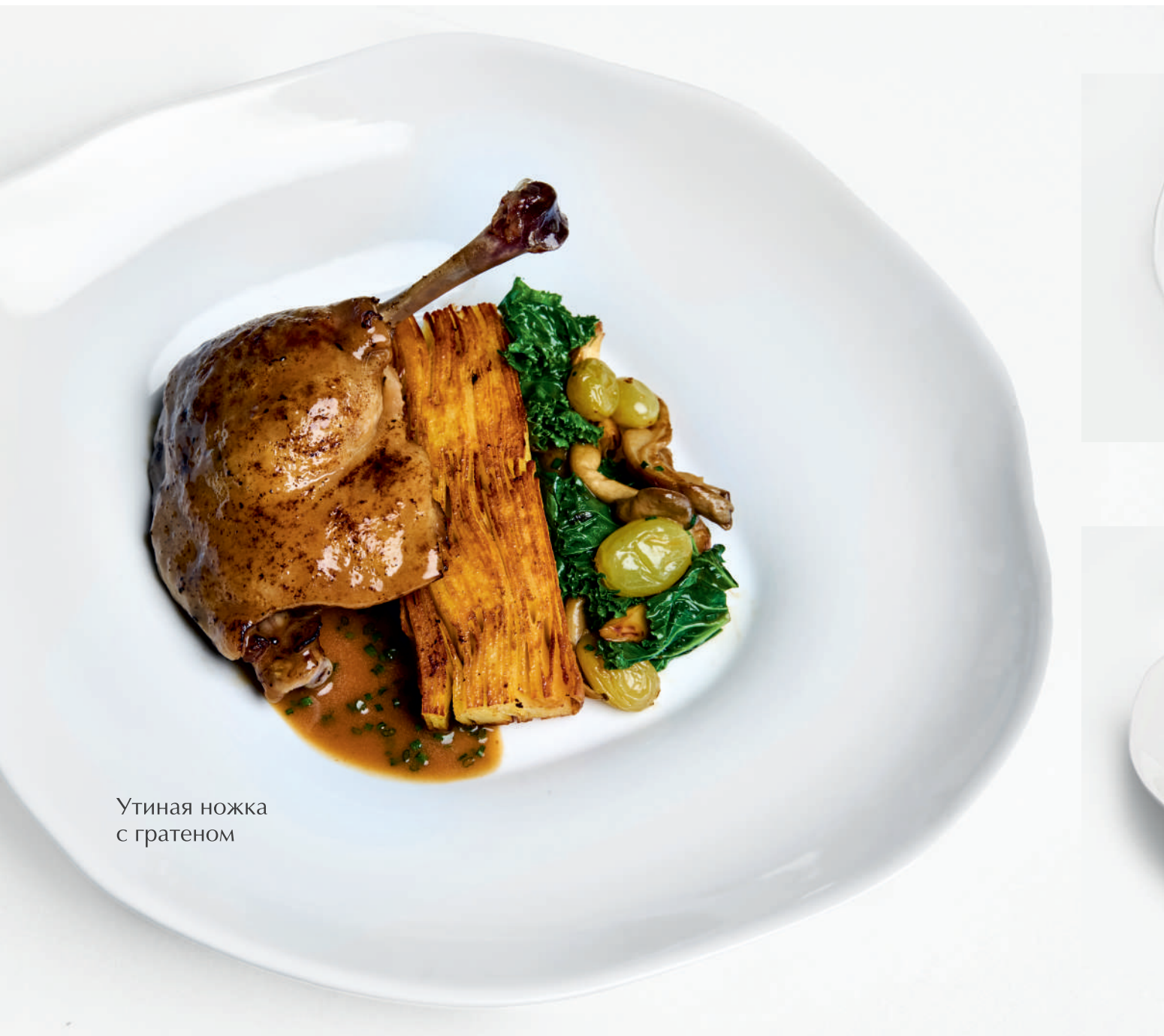
Утиная ножка с гратеном