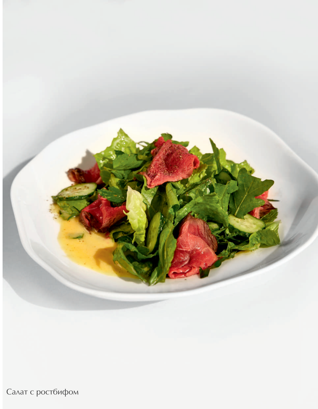
Салат с ростбифом