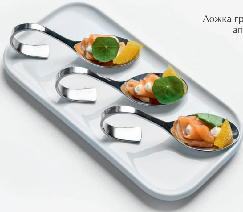
Ложка гравлакс апельсин