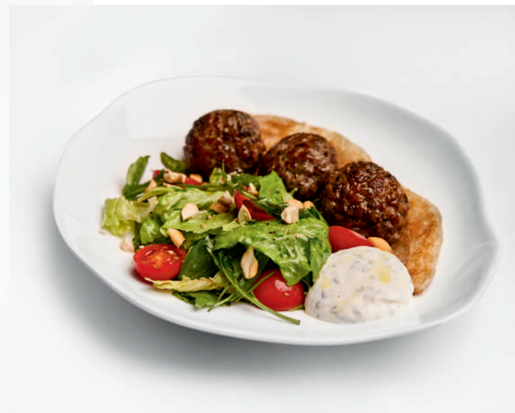
Кюфта из ягненка