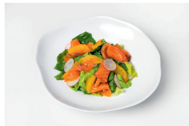
Салат с гравлаксом и апельсинами