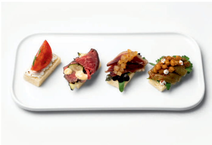
Брускетты • с томатом • с ростбифом • с баклажаном • с уткой