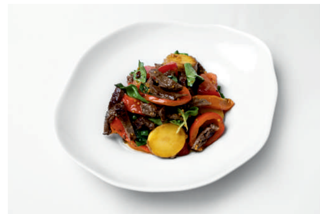
Салат с говядиной