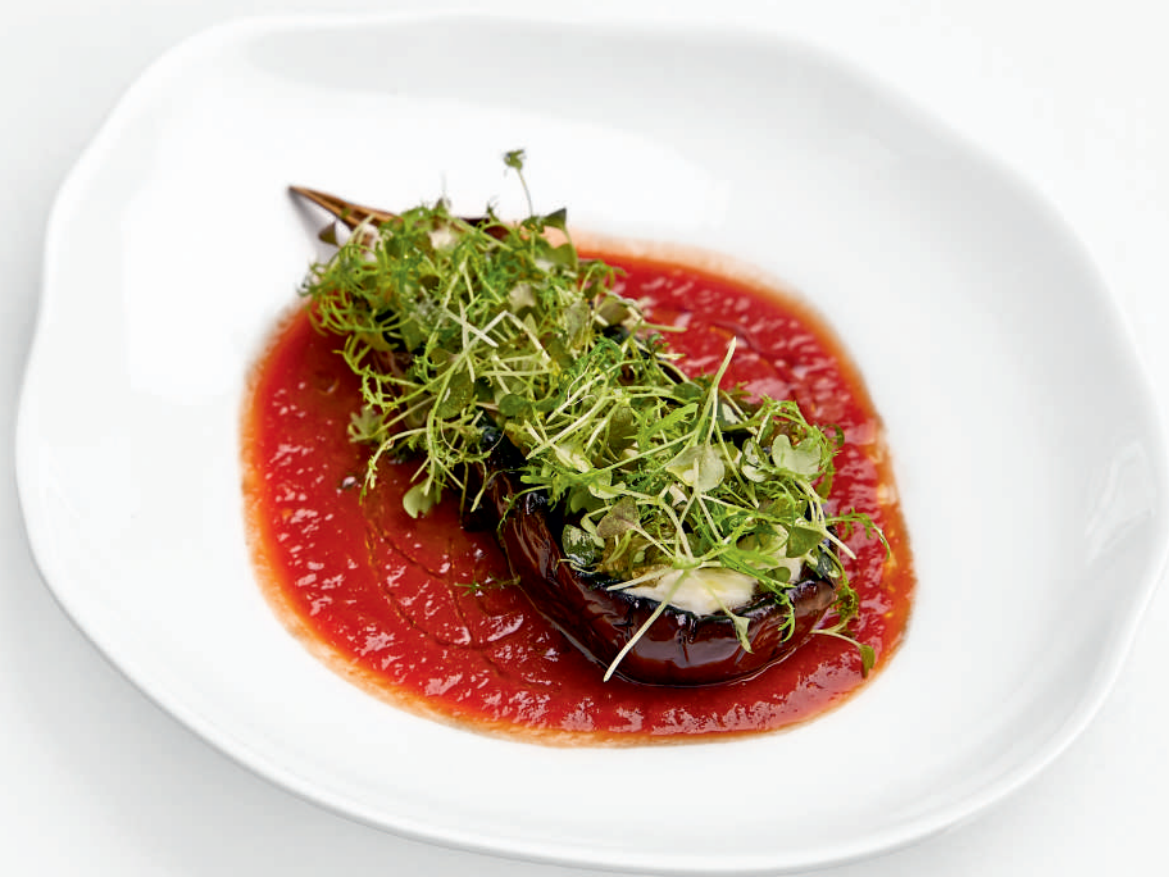
Пармиджано из баклажана