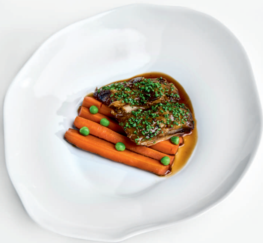
Говяжье ребро с кленовой морковью