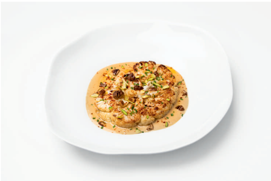
Стейк из цветной капусты с желтым карри