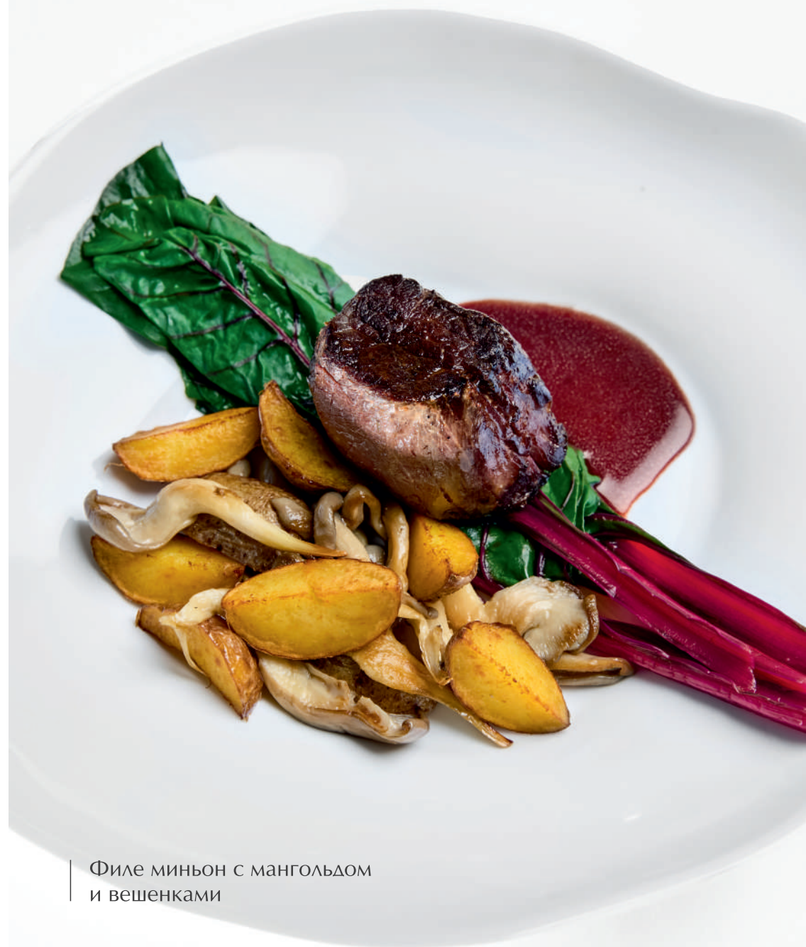
Филе миньон с мангольдом и вешенками