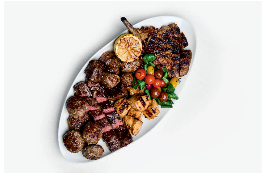
Большой мясной сет