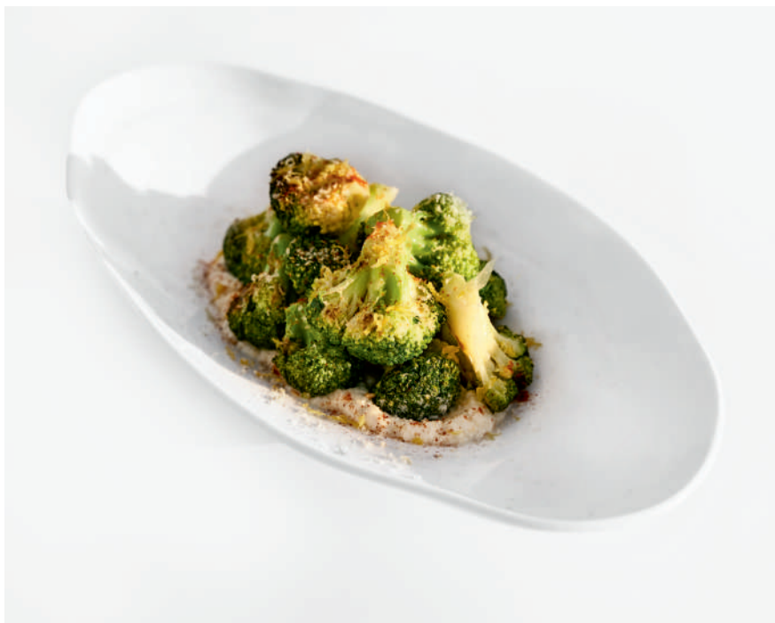
Брокколи на гриле с орехами