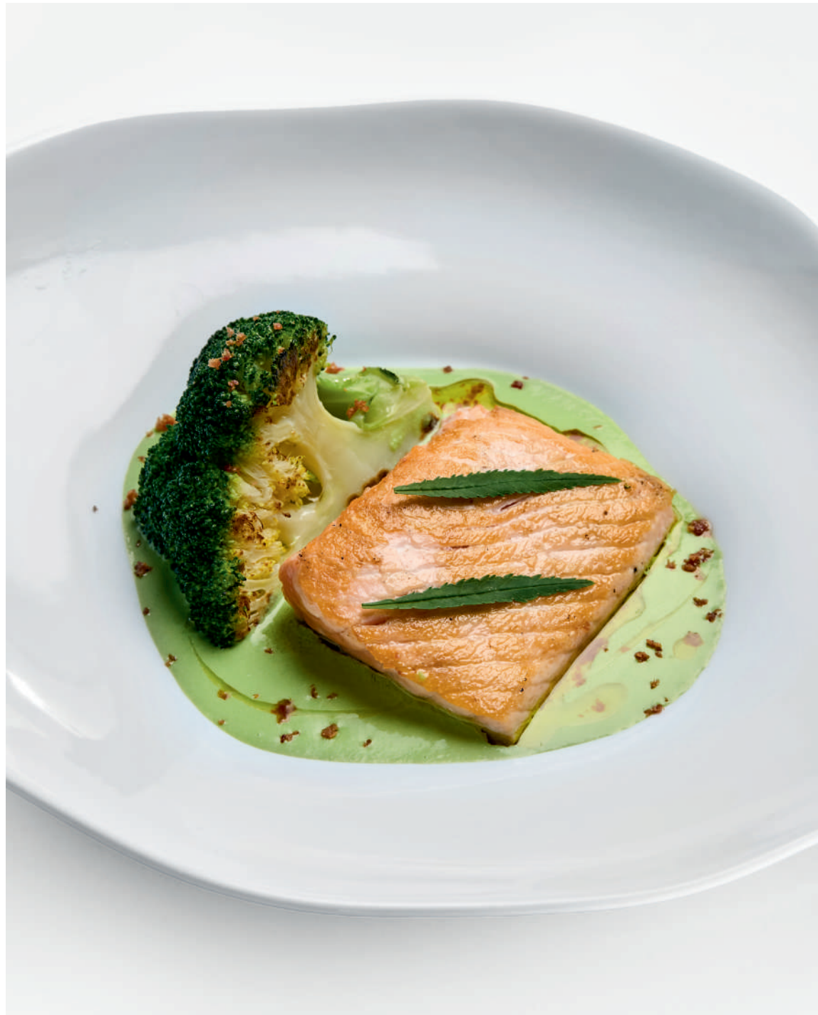
Лосось с брокколи и соусом из горошка