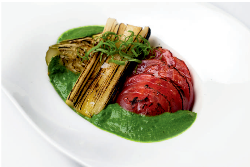
Обоженные овощи с зеленым соусом