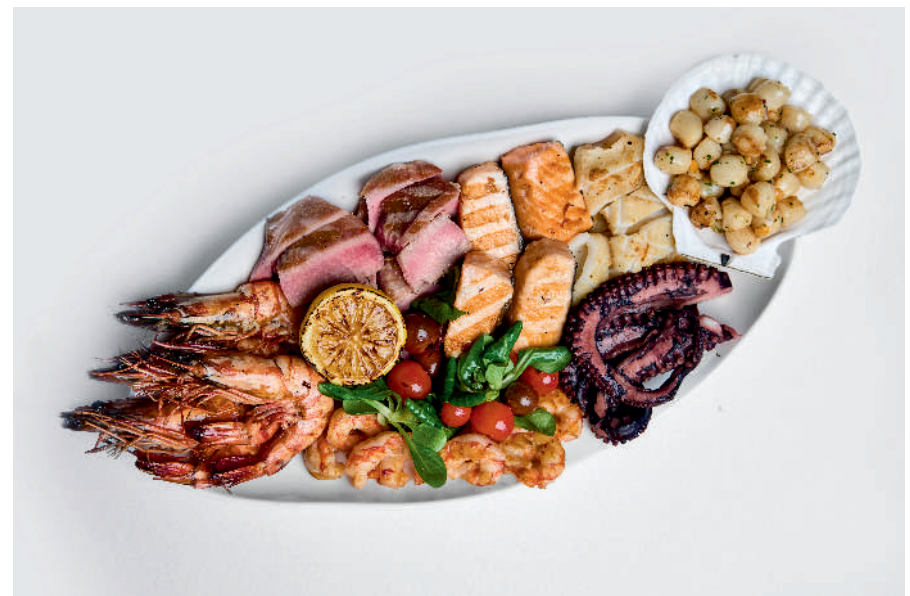
Большой морской сет