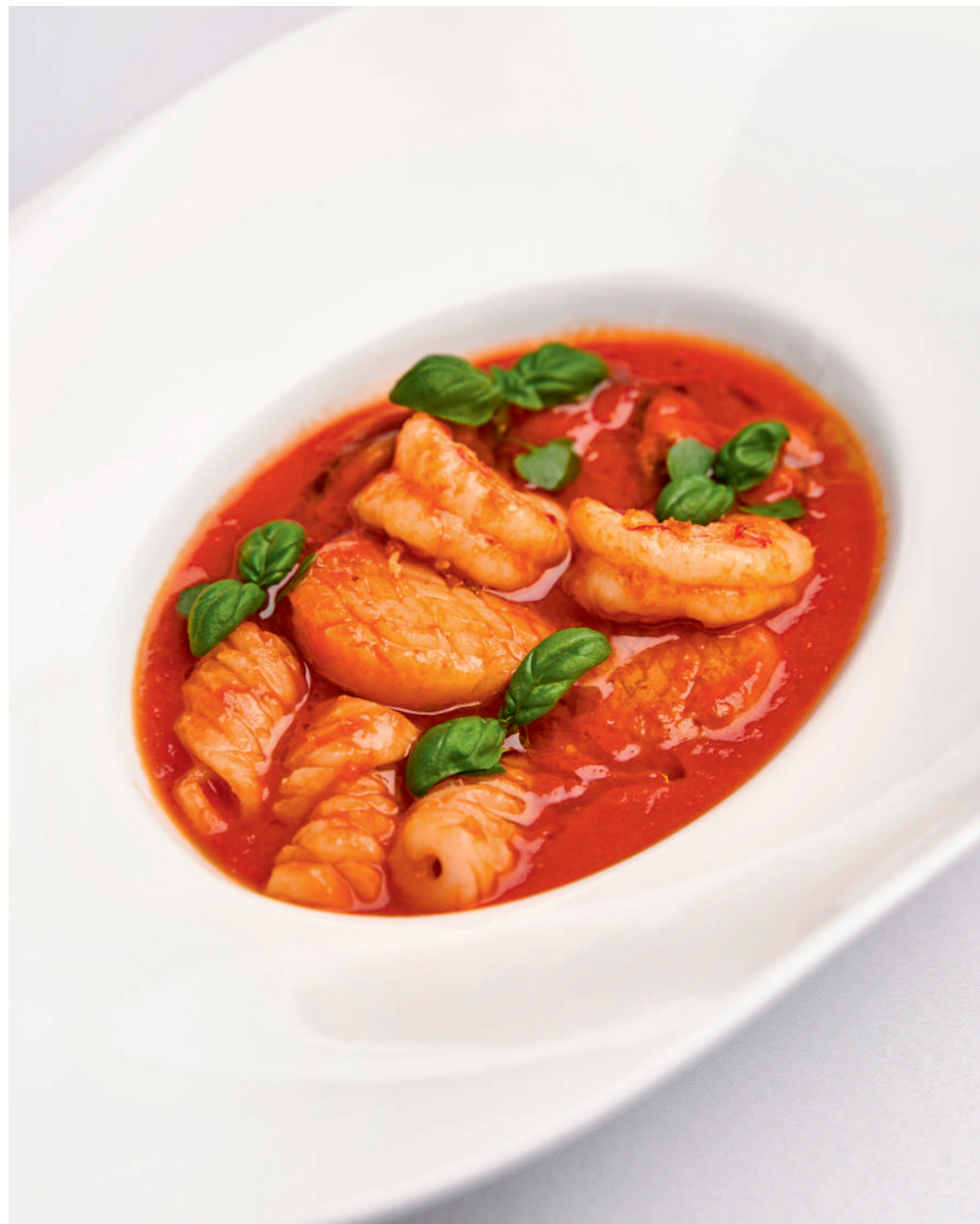
Соте из морепродуктов