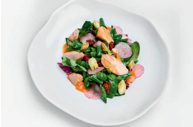
Салат с печеным лососем