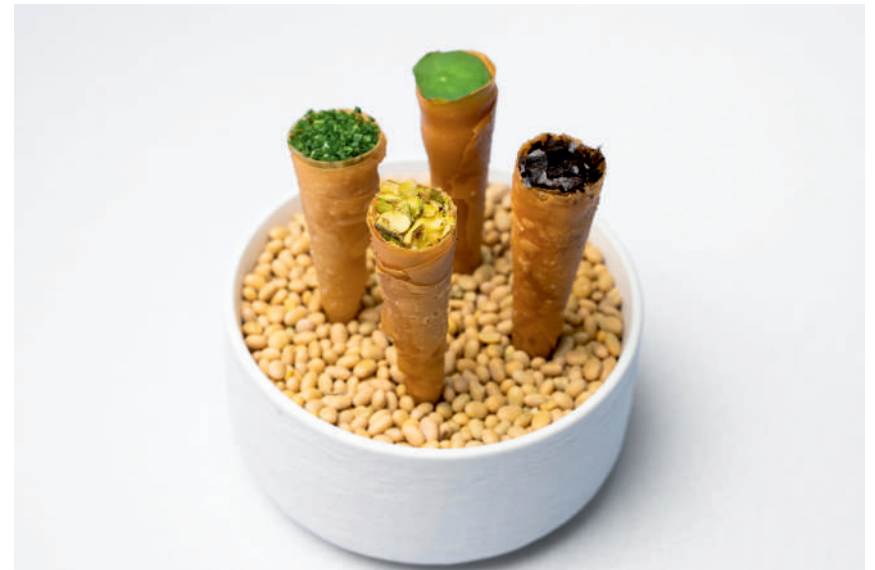
Рожок с муссом из икры трески/ с кремом из угря / с грибным паштетом