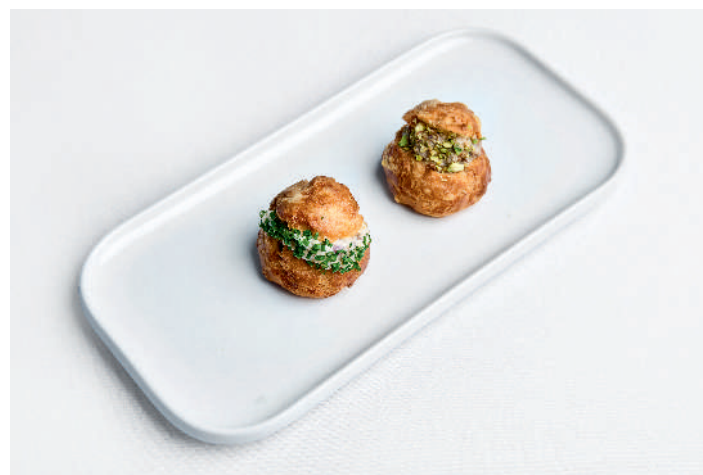
Гужеры с грибным паштетом