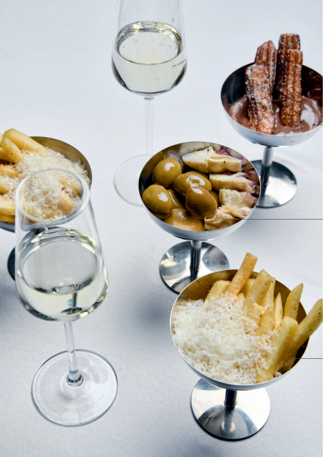
Креманка чуррос с нутеллой