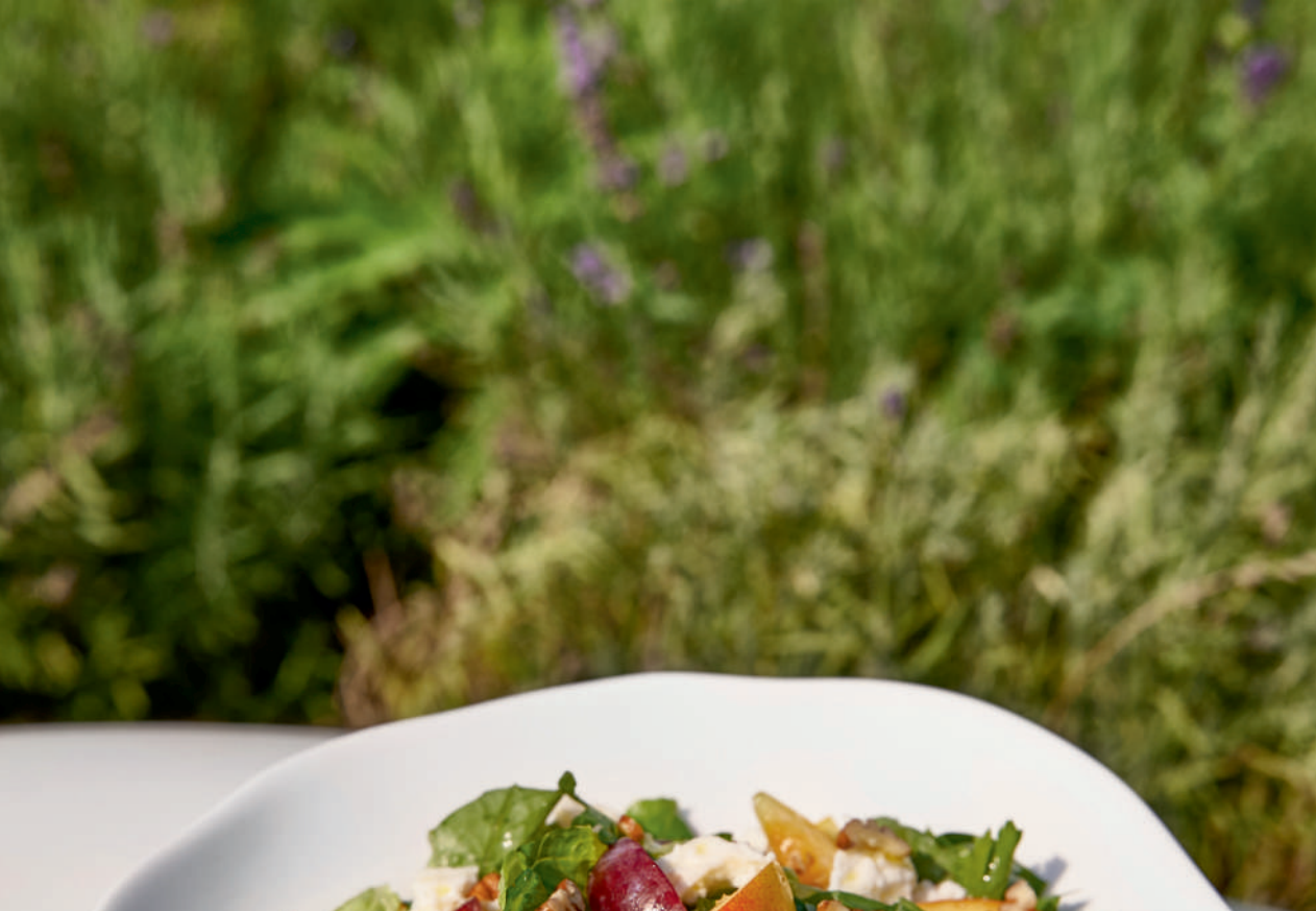
Салат с сезонными фруктами и сыром