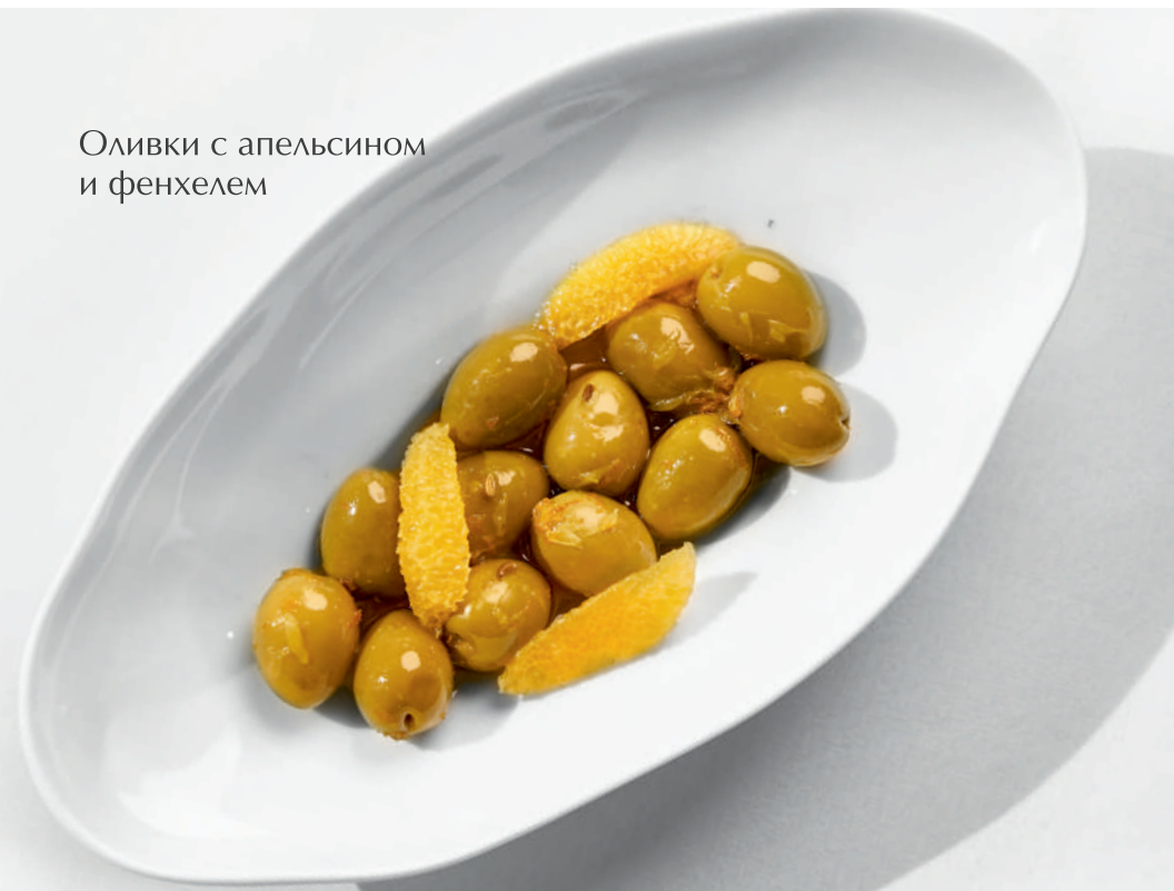
Оливки с апельсином и фенхелем