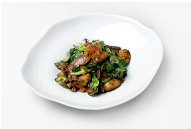
Салат с уткой и ферментированной грушей