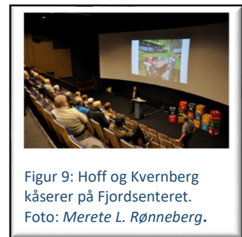
Figur 9: Hoff og Kvernberg kåserer på Fjordsenteret.