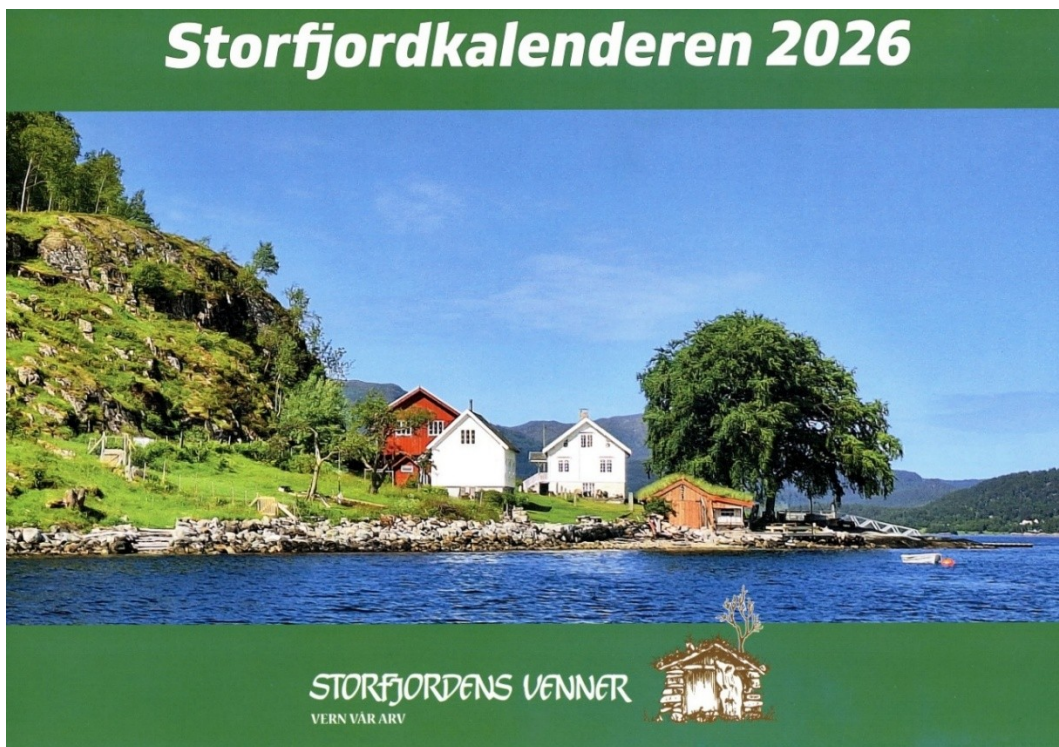
Framsida av 2026-kalenderen med bilde av garden Røneset.