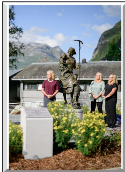
Mor med barn