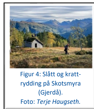
Figur 4: Slåttent og krattrydding på Skotsmyra (Gjerdå).