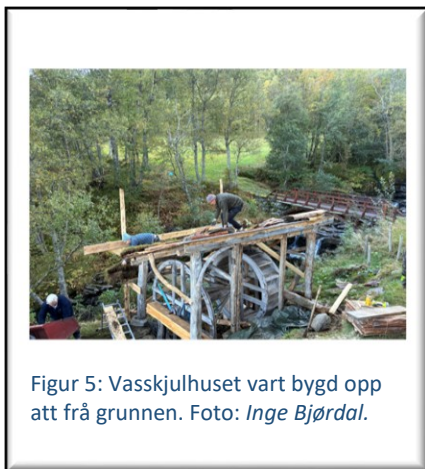
Figur 5: Vasshjulhuset vart bygd opp att frå grunnen.

Det største dugnadsjobben i 2025 var ferdigstillinga av arbeidet med reparasjon av vasshjulhuset. Dette er no ferdig restaurert heilt frå grunnen, og det er berre å slå på bordkledning på to veggjar som står att. Dette vart gjort på første dugnad i 2026.