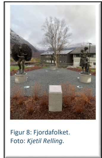
Figur 8: Fjordafolket.

Det er elles gjort ein svært omfattande innsats med formidling om StVe og verksemda vår i form av føredrag og kåseri med video, bilete og prat, sjå tabell nedanfor: