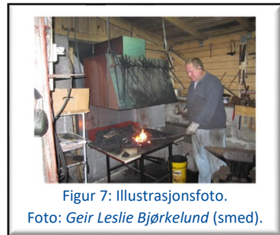
Figur 7: Illustrasjonsfoto.

Dette er det neste større prosjektet på Ytste Skotet. Det vart sendt inn søknad til Kulturminnefondet om å setje smia i stand med fullt utstyr (esse, belg, reiskapar) slik at ho kan brukast til mindre smijarnsarbeid til garden, og ikkje minst til opplæring/kurs. Svar på søknaden var ikkje på plass når denne meldinga vart skriven.