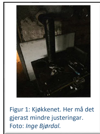
Figur 1: Kjøkkenet. Her må det gjerast mindre justeringar.