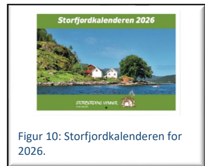
Figur 10: Storfjordkalenderen for 2026.

Kalenderen er etterspurd og TV-serien har ført til at mange utan tilknytning til organisasjonen har bede om å få han tilsendt. Sjå elles omtale i årsmeldinga frå Formidlingsgruppa.