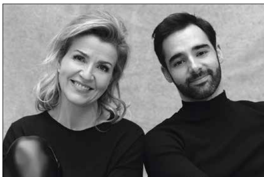
Anne-Sophie Mutter und Pablo Ferrández S. 14