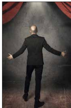
Unterschätzte Sänger S. 37