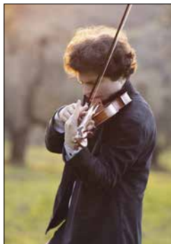
Augustin Hadelich S. 29