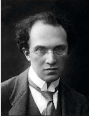
Franz Schreker S. 74