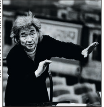
Seiji Ozawa S. 48