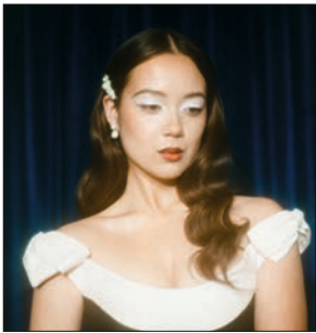
Laufey S. 84