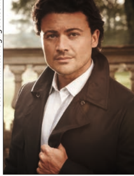
Vittorio Grigolo S. 30