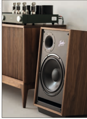
Pylon Audio Jade 20 S. 78