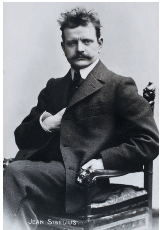
Jean Sibelius um 1898/1900