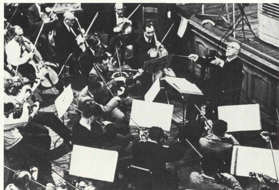
Yehudi Menuhin mit dem Bath Festival Orchestra. Foto rechts: Sir Thomas Beecham dirigiert.