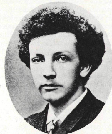
Von der Plattenindustrie schon damals umworben: Richard Strauss

Die Sopranistin Lilli Lehmann (r.) empfahl eine Schallplatten-Karriere für den Dirigenten und Komponisten Siegfried Wagner (l.), den einzigen Sohn von Richard und Cosima Wagner.