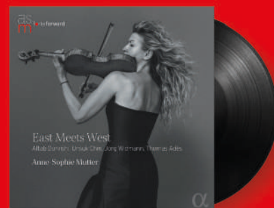
ALPHA 1247 - 2LP