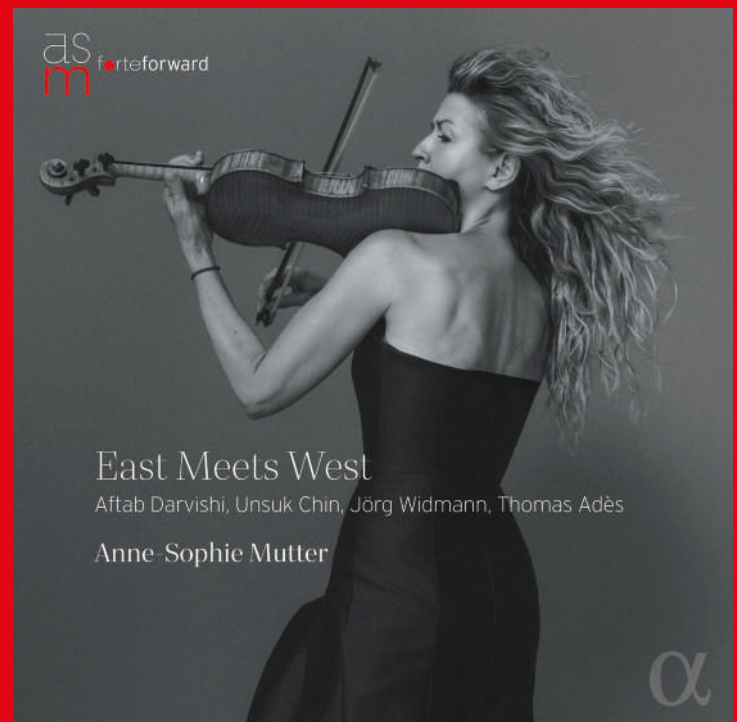
ALPHA 1244 - 1CD

Mit „ASM Forte Forward“ bringt Anne-Sophie Mutter bei Alpha Classics ihre eigene Serie heraus, die sich der Musik unserer Zeit widmet.