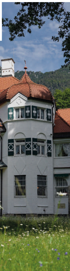
Strauss im Garten seiner Villa in Garmisch, 1938