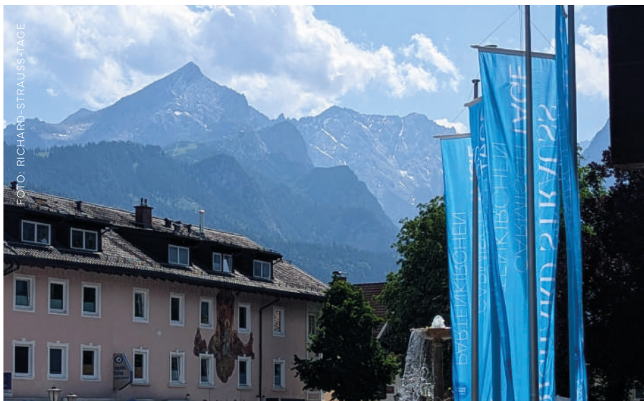
Die Berge sind von Garmisch-Partenkirchen aus zum Greifen nah