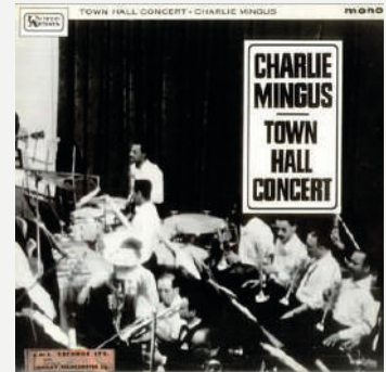
Mingus: The Complete Town Hall Concert 1962; Blue Note