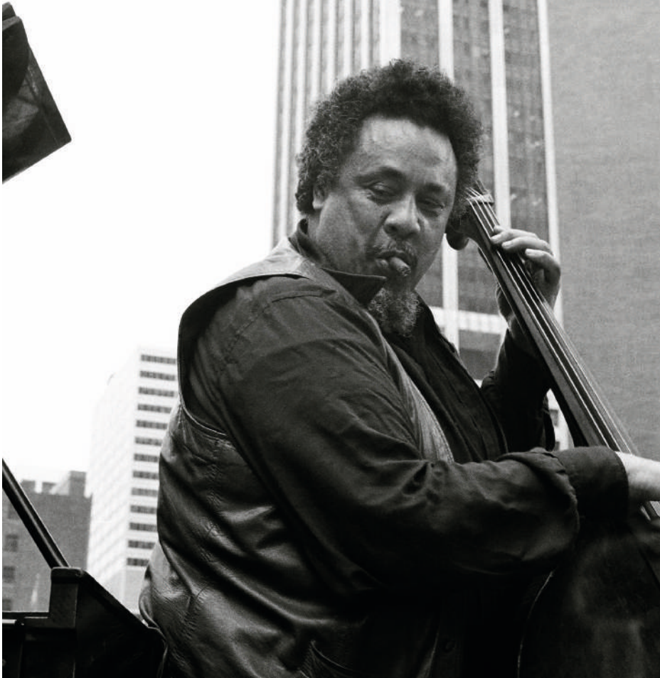
Charles Mingus 1976 in New York