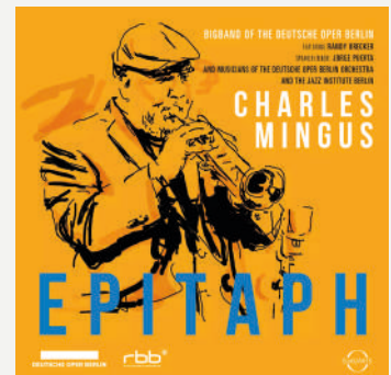
Mingus: Epitaph; Bigband der Deutschen Oper Berlin, Titus Engel (2022); EuroArts