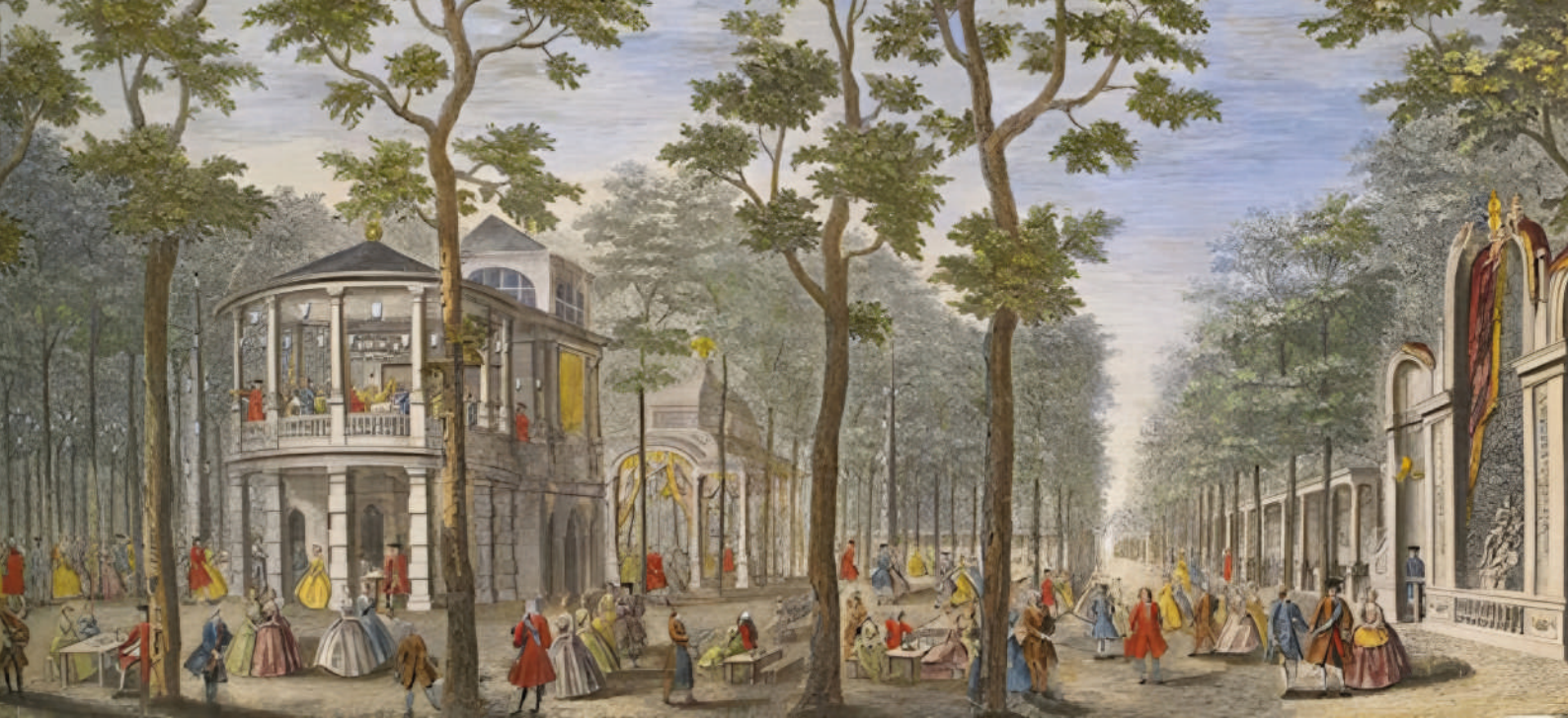
Die Vauxhall Gardens, rechts die Händel-Statue, zeitgenössischer kolorierter Stich