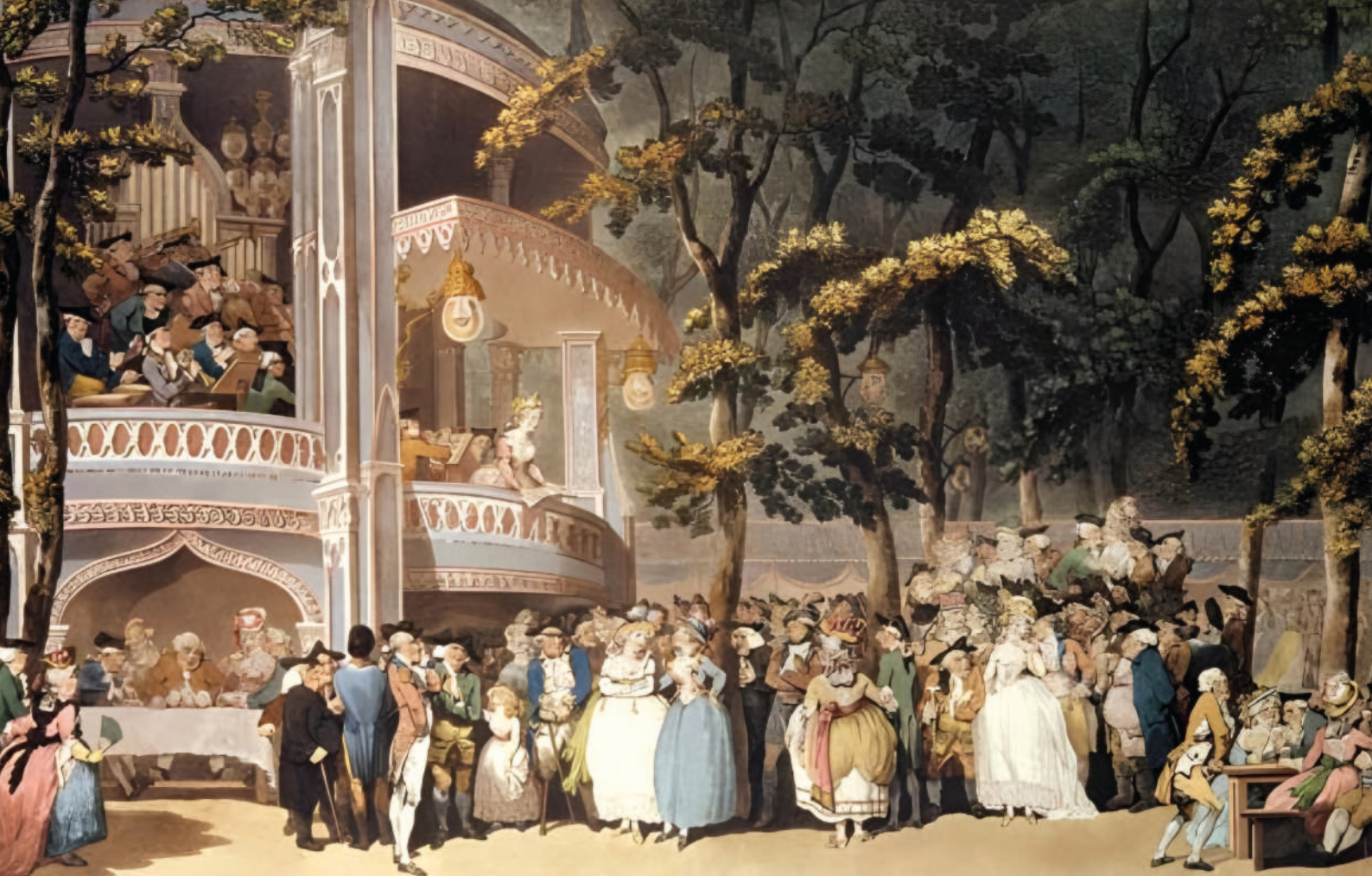
Thomas Rowlandson, Vauxhall Gardens (Zeichnung von 1784). Unter den Dargestellten erkennt man zahlreiche bekannte Persönlichkeiten der Zeit

statt, oder es wurde einzelnen Künstlern die Möglichkeit geboten, dort Subskriptionskonzerte zu veranstalten. Der damalige musikalische Reichtum Londons ist heute kaum mehr zu überblicken, auch weil viele Einblattdrucke der Zeit (vornehmlich Lieder und Gesänge, die auf ein Blatt Notenpapier passten) nicht der Aufbewahrung für würdig befunden wurden.