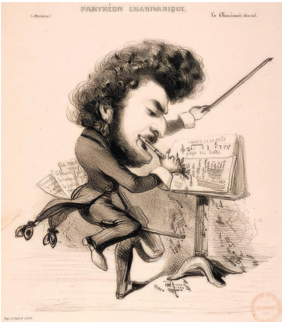
Karikatur Julliens von Benjamin Roubaud in der Zeitschrift „Charivari“