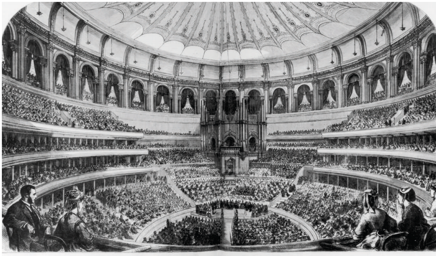
Die Eröffnung der Royal Albert Hall, 1871