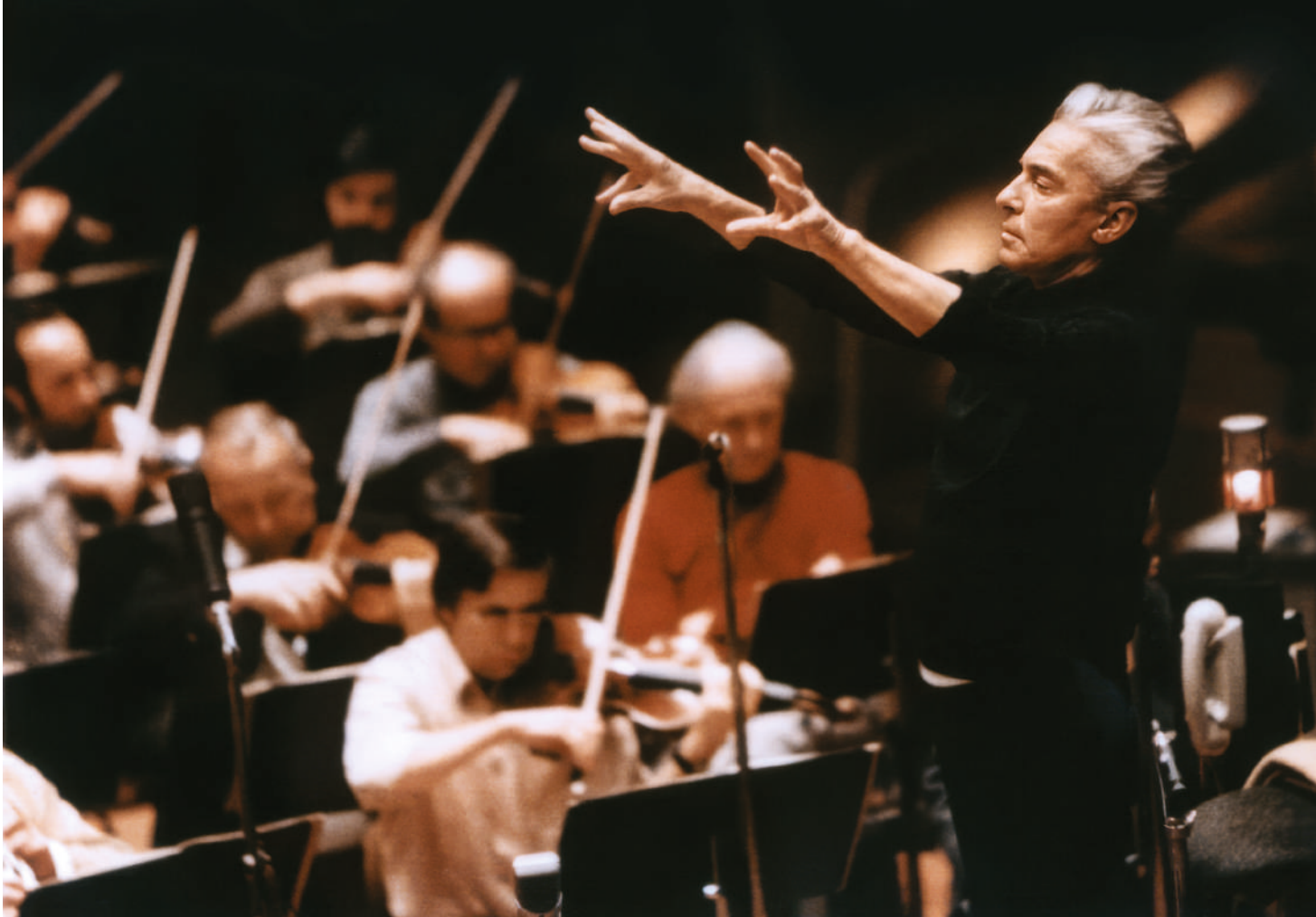
Herbert von Karajan mit den Berliner Philharmonikern, 1973