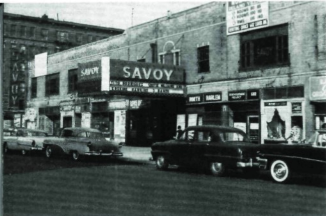
Oben: Der berühmte „Savoy-Ballroom“ in Harlem, der jetzt für immer geschlossen wurde.