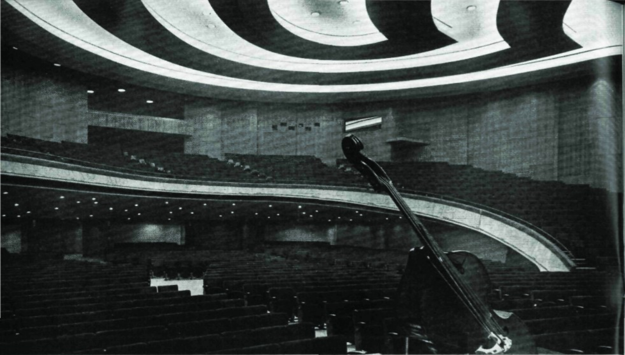
Von der Bühne des großen Konzertsales blicken wir in den Zuschauerraum mit seiner Teakholzverkleidung