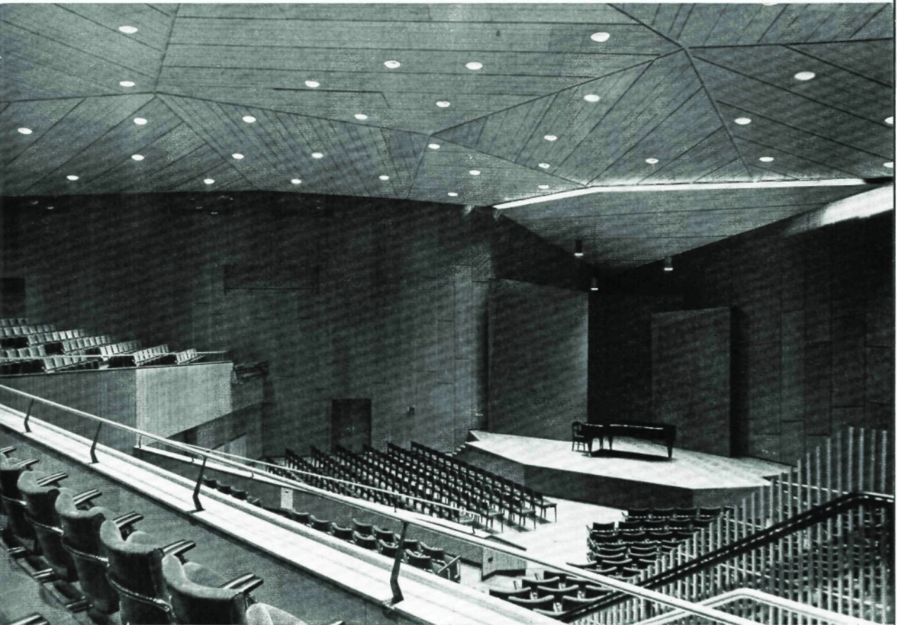
Intim und großartig zugleich ist der Kammermusiksaal, über dem eine Eschenholzdecke frei eingehängt ist.

Zweitausend Sitzplätze faßt der große ecken- und nischenlose Saal, in asymmetrische Gruppen gefaßt, von jedem Platz aus eine gute Sicht auf die Bühne bietend. Keine Gliederung um eine Achse ist hier das Ordnungsprinzip des Raumes, der bei aller Gewaltigkeit fast leicht und graziös wirkt und dessen Decke aus konzentrischen, von Lichtlinien begleiteten Kreiselementen zu schweben scheint. Teakholz verkleidet das Rund der Rückwände, die unverputzte Betonmauer wölbt sich konvex hervor, durch sparsame Mosaikeffekte und eine golden glänzende Türumrahmung geschmückt. Vor allem den Musiktechniker interessiert die Reihe übereinander gestaffelter Balkons und Fenster, die Radio-, Fernseh-, Schallplattenregie- und Aufnahme Räume enthalten. Die Telefunken-Decca-Gesellschaft und die Deutsche Grammophon Gesellschaft haben wegen der idealen akustischen Verhältnisse Aufnahmen hier vorgesehen.