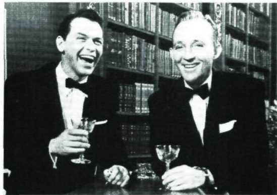
Frank Sinatra und Bing Crosby