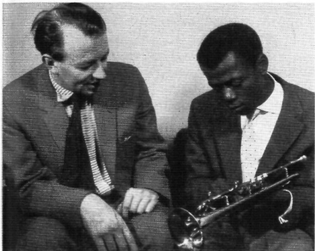
Humphrey Lyttelton und Billy Mo aus Trinidad

Wirft man am folgenden Tag einen Blick in das englische Fachblatt „Melody Maker“, so findet man eine ausführliche Betrachtung von Humphrey Lyttelton über eines der gerade in der Musikwelt zur Diskussion stehenden Themen. Er ist nicht nur Musiker, sondern auch Journalist, und, was die wenigsten wissen, Karikaturist. In dieser Eigenschaft hat er lange Zeit hauptberuflich für das englische Millionenblatt „Daily Mail“ gearbeitet. „Dieser Job war eine Goldgrube“, schmunzelt er noch