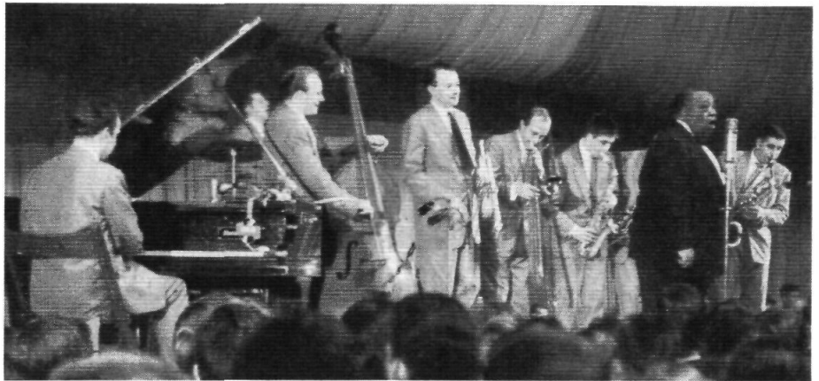
Humphrey Lyttelton — Band mit Jimmy Rushing, vocal

sprechend interpretiert wird.“ Humph gründete also eine eigene Band und musizierte auf seine Art. Das Banjo mußte der Gitarre weichen, er selbst blies eine moderne Trompete, die auch die anderen Musiker in eine moderne Richtung führte und den alten Jazz vor allem mit Swing erfüllte. Bald schossen dann in London Jazzclubs wie Pilze aus der Erde. Unbekannte Namen tauchten auf, wurden schnell zu einem Begriff, nicht nur in England. Der populärste von allen, die in den Fußstapfen Humphrey Lytteltons wandeln, ist gerade