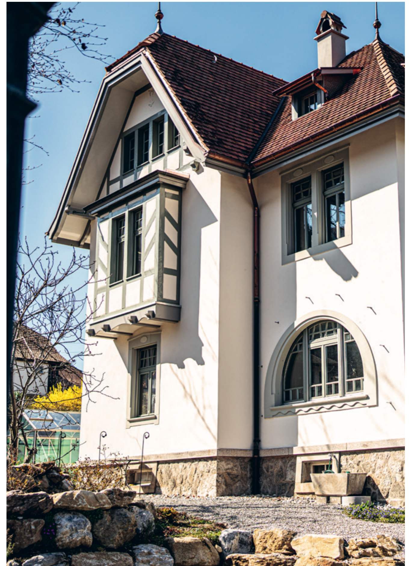
Die Villa Beata in Spiez – eine Zeugin der Zeit.