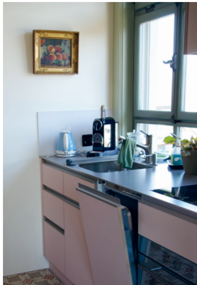
... wie auch moderne Komponenten schätzen.

kennt er sich mit Häusern aus, die schon bessere Tage gesehen haben, deren Substanz jedoch die Zeit überdauert.