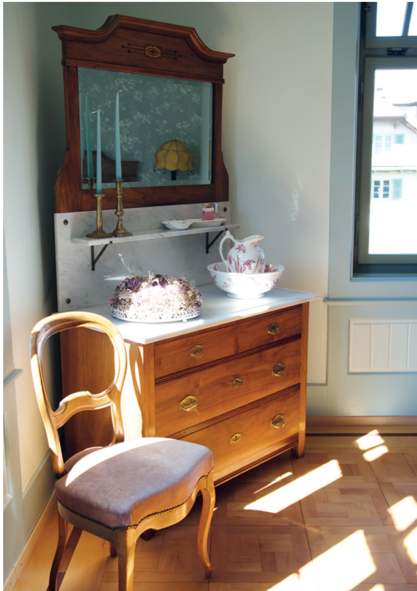
Washkomoden sind fast vollständig aus den Wohnungen verschwunden. In der Villa Beata scheinen sie jedoch nicht aus der Zeit gefallen.

Müller unnötig findet. «Würde öfter umgebaut und renoviert und dabei mit dem bestehenden Material gearbeitet, könnte sehr viel Müll vermieden werden.» Gerade alte Gebäude wie die Villa Beata seien noch mit einer völlig anderen Philosophie gebaut worden. Die Materialien wurden so gewählt, dass sie möglichst lange Bestand haben. Die meisten Häuser, die heute abgerissen werden, können nie mehr in der gleichen Qualität ersetzt werden. Deshalb verwendete das Umbau-Team nicht nur die Ziegel der Villa wieder, auch reinigten sie den alten