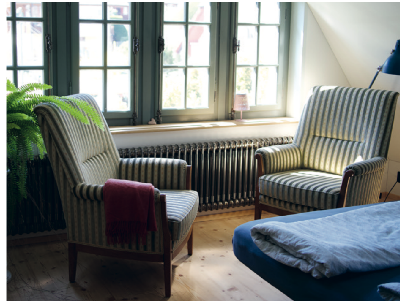
Die Villa hat genügend Fenster für lichtdurchflutete Räume, die trotzdem sehr gemütlich wirken.

neue Geräte in die Küche eingebaut werden und moderne Elemente Kontraste setzen. «Doch wenn ich mir anschau, wie lange diese Häuser schon stehen – 100 oder 200 Jahre, oder noch länger – sind wir in ihrem Leben nur ein kurzer Moment.. Auch wenn es uns gehört, sind wir nur Gast in so einem Haus. Und wenn wir als Gast sagen, wir machen alles neu, dann klauen wir dem Haus die Seele.»