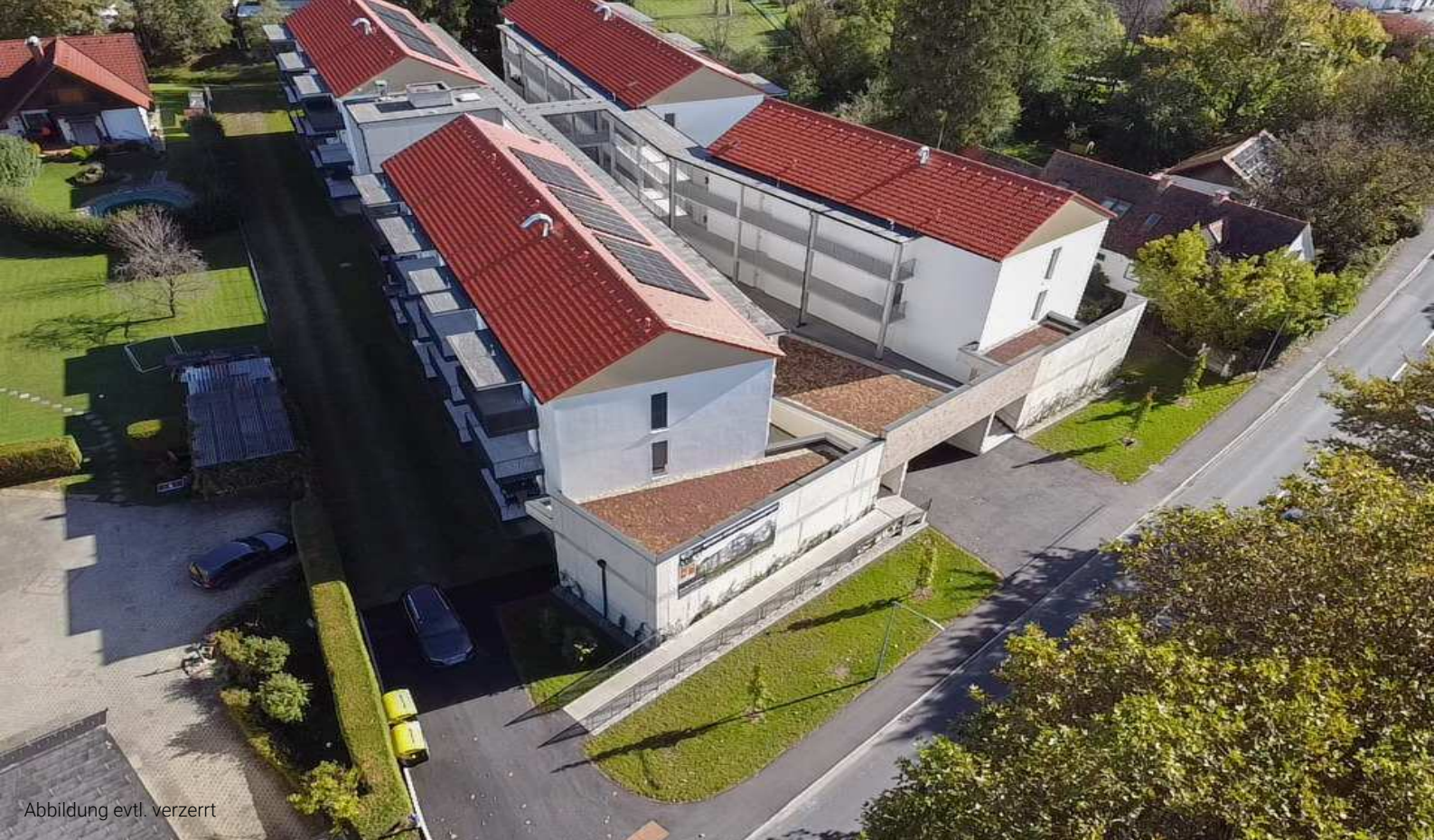
Abbildung evtl. verzerrt