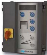
i-Vision TAD (Option)