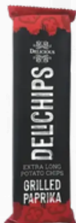
Delichips paprika 60g