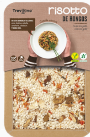
Paddenstoelenrisotto 280 g