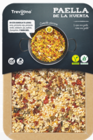
Paella met 6 groenten 280 g