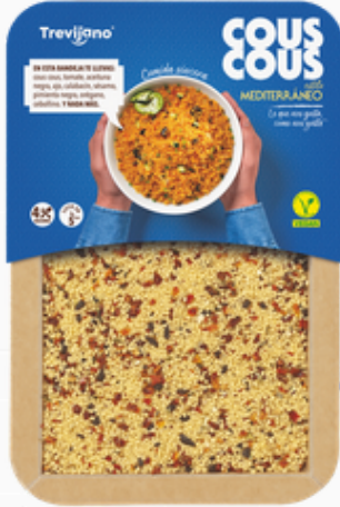
Mediterrane couscous 280 g