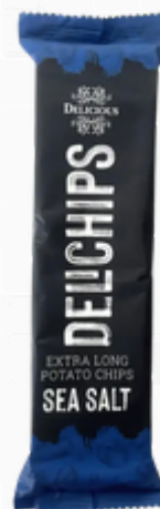
Delichips zeezout 60g