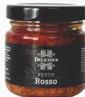
Pesto rosso 90g