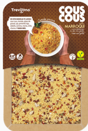
Marokkaanse couscous 300 g