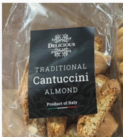
Cantuccini amandelen 150g