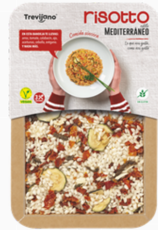
Mediterrane risotto 280g