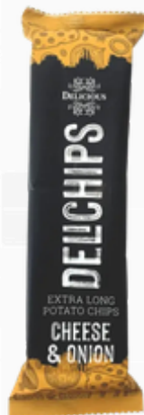
Delichips kaas ui 60g