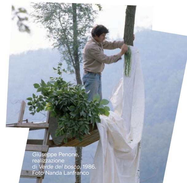
Giuseppe Penone, realizzazione di Verde del bosco, 1986.